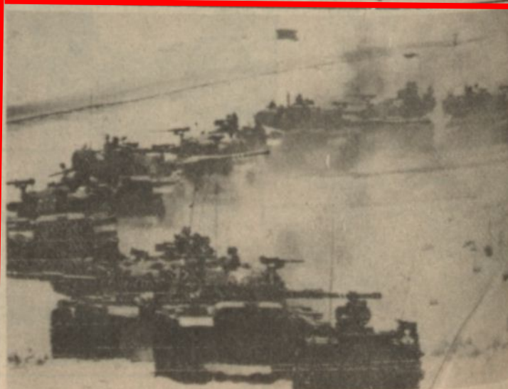
طابور من المدرعات الاسرائيلية التي بدأت الانسحاب امس الى مسافة ١٠ كيلو مترات شرق خط فصل القوات في سيناء