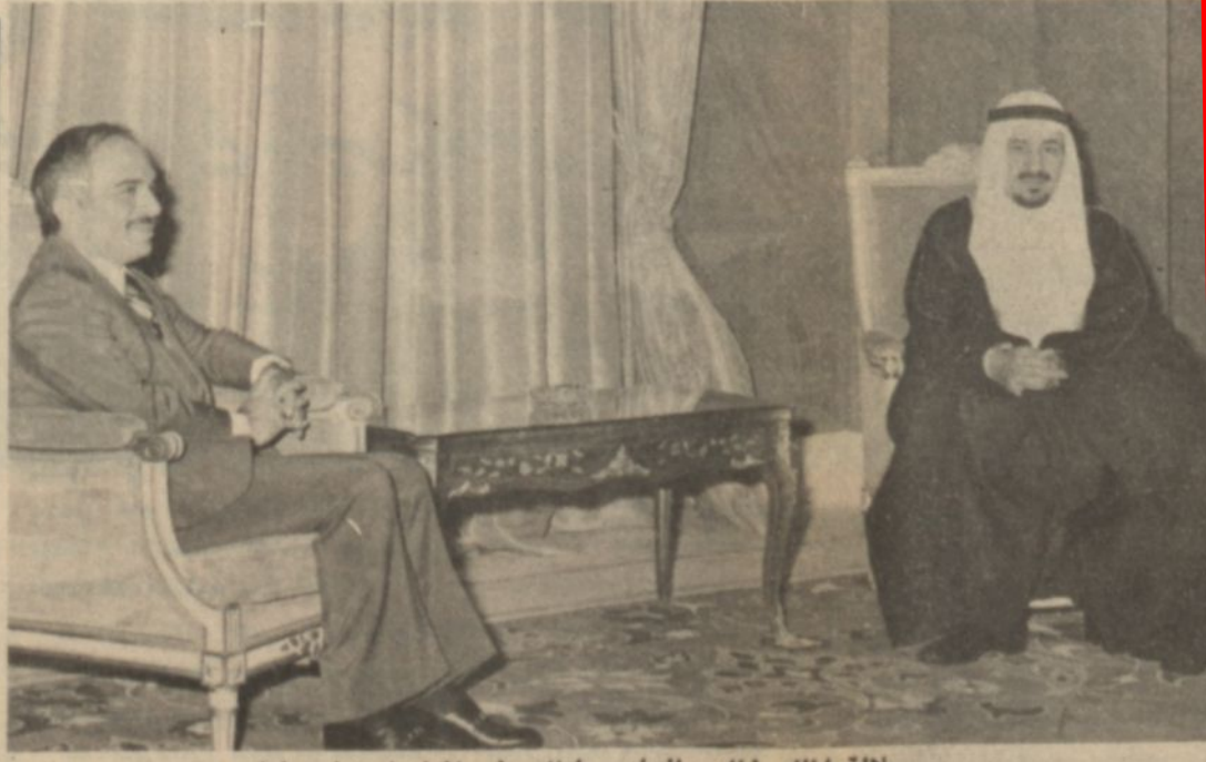
جلالة الملك خالد والعاهل الاردني اثناء اجتماعهما امس