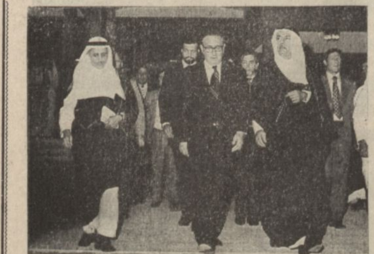
امير نايف بن عبد العزيز نائب وزير الداخلية مع مسؤولي الشركة المقترنة بمشروع صيانة وتشغيل محطات وشبكات المجاري للمدينة المنورة

صرح مصدر مسؤول في وكالة وزارة الشؤون البلدية بان صاحب السمو الملكي الامير نايف بن عبد العزيز نائب وزير الداخلية قد وقع عقود صيانة وتشغيل محطات وشبكات المجاري للمدينة المنورة وتتضمن هذه العقود أعمال الاشراف والصيانة والتشغيل لشبكات المجاري ومحطات الضخ التابعة لها ومحطات التنمية في المدينتين