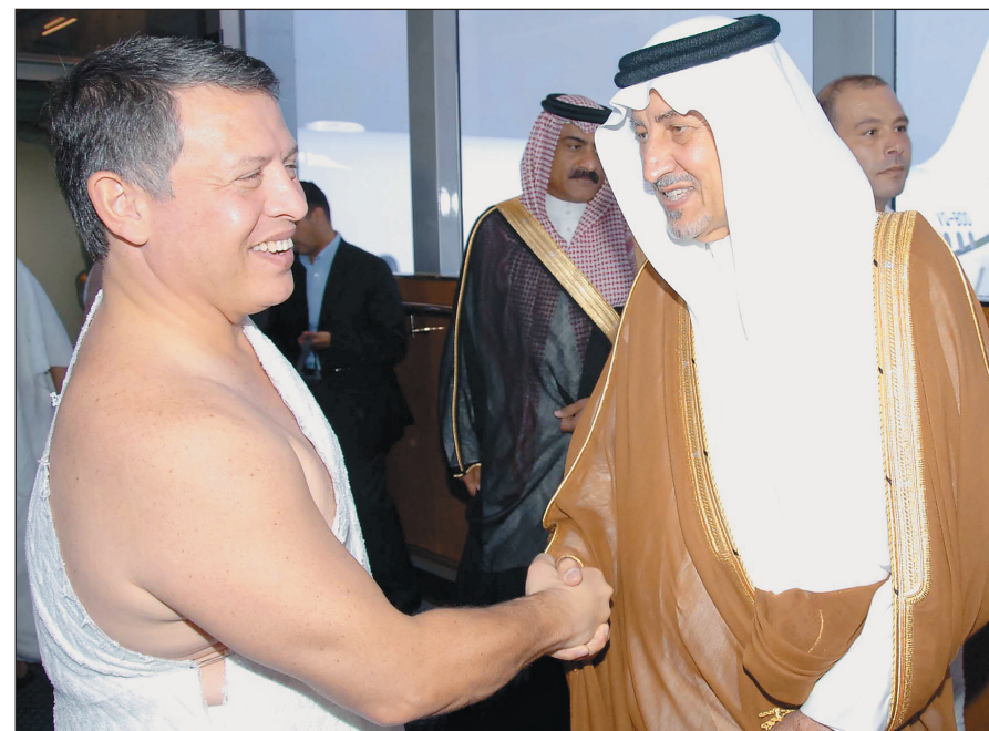
الأمير خالد الفيصل مستقبلاً العاهل الأردني في جدة أمس.

في المجالات كافة، بما يصب في مصالح البلدين والشعبين. حضر الاجتماع صاحب السمو الملكي الأمير نايف بن عبد العزيز النائب الثاني لرئيس مجلس الوزراء وزير الداخلية وصاحب السمو الملكي الأمير خالد الفيصل بن عبد العزيز أمير منطقة مكة المكرمة وصاحب السمو الملكي الأمير عبد الإله بن عبدالعزيز مستشار خادم الحرمين الشريفين وصاحب السمو الملكي الأمير مقرن بن عبد العزيز رئيس الاستخبارات العامة ومعالى وزير التجارة والصناعة