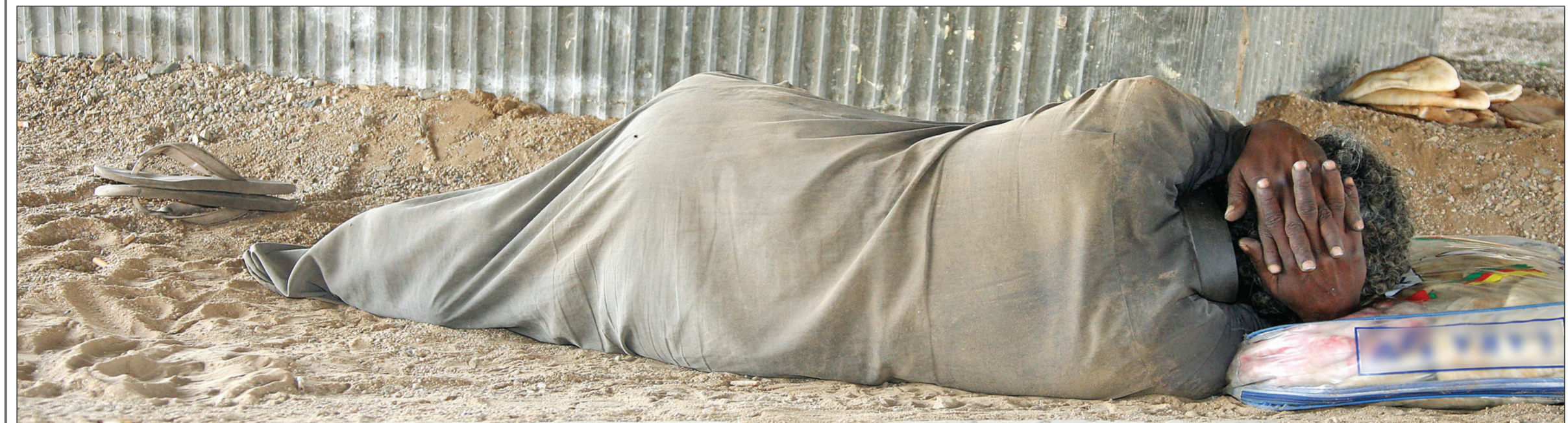
معتل نفسياً مستلقياً تحت جسر بجوار محطة النقل الجماعي أمس في جدة.