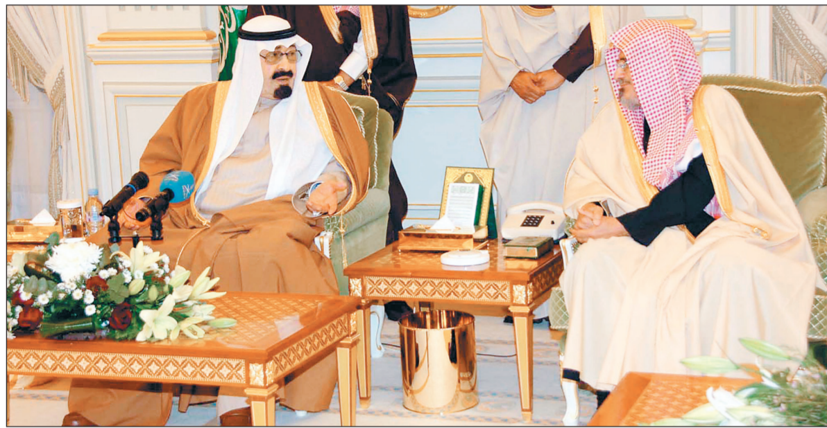
خادم الحرمين الشريفين مستقبلاً رئيس المجلس الأعلى للقضاء د. صالح بن حميد.