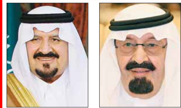
نائب خادم الحرمين الشريفين خادم الحرمين الشريفين

يضع صاحب السمو الملكي الأمير خالد الفيصل بن عبدالعزيز أمير منطقة مكة المكرمة حجر الأساس لمشروع الإسكان الميسر في أم الجود في العاصمة المقدسة السبت المقبل، حيث تقع أرض المشروع خلف مدارس عبد الرحمن فقيه على مساحة إجمالية تبلغ ٦٧٠ ألف متر مربع، والمنفذ من شركة البلد الأمين.