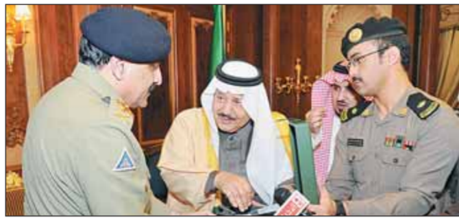
النائب الثاني مستقبلاً في مكتبه في الرياض البارحة الفريق أول ركن خالد شميم والوفد المرافق له.