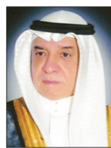
عبد الله زينل

في هذا الشأن. ورفع وزير التجارة والصناعة عبدالله بن أحمد زينل علي رضا باسمه واسم جميع منسوبي الوزارة والشكر وتقدير جميع لخدمات الحرمين الشريفين الملك عبدالله بن عبدالعزيز آل سعود على الأوامر السامية الكريمة التاريخية، التي شملت دعم كافة القطاعات التنموية والاقتصادية في المملكة، والتي تعكس حرص القيادة على توفير كافة سبل العيش الكريم للشعب السعودي وتؤكد على عمق التلاحم بين الشعب وقيادته، ما يدحض كل من يحاول زرع الفتنة وعزعة الأمن في هذا البلد المعطاء. وأكد على حرص القيادة على كل ما من شأنه رفاهية المواطن.