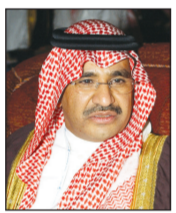
د. عبدالرحمن التويجري

واس - الرياض أكد رئيس هيئة السوق المالية الدكتور عبدالرحمن بن عبدالعزيز التويجري أن كلمة خادم الحرمين الشريفين الملك عبدالله بن عبدالعزيز التي في جانبها الاقتصادي بالذات عالجتها بشكل مباشر وشامل لمستقبل بلاده وفيها توجيه لموارد البلاد لخدمة أبناء شعبه، مشيراً إلى أنها كانت شاملة وواقعية للنواحي الاقتصادية الذي تبناه وطبقه منذ سنوات.