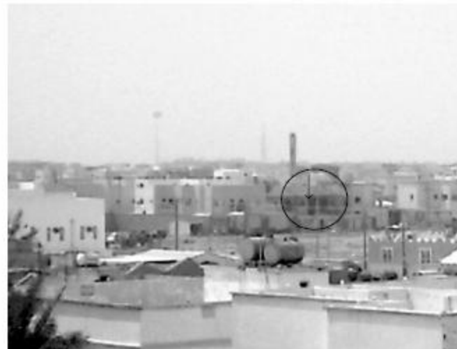
□ تصوير - عبدالله المريسي