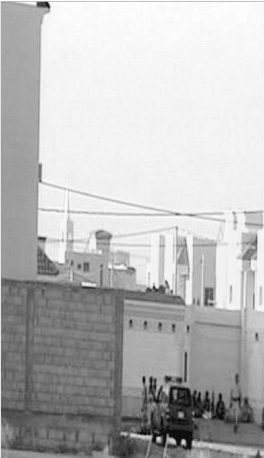
المنطقة كما تبدو صباح أس