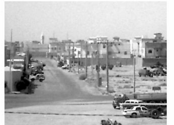
الهدوء يتجلى على شوارع الرس صباح أس والدائرة تشير إلى القنابل المحاصرة