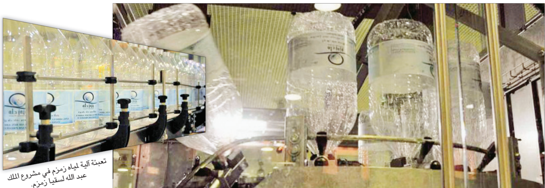
مصنع المياه في مشروع الملك عبد الله لسقيا زمزم في مكة المكرمة.

إلى آخر مراحل التعبئة. وأضاف أن المشروع يحتوي لتخزين وتوزيع العبوات المنتجة من مصنع التعبئة تجهز بانظمة تكييف وأنظمة إنذار وإطفاء الحريق بتكلفة تبلغ أكثر من ٧٥ مليون ريال، يمثل ١٥ مستوى لتخزين وتوزيع ١,٥ مليون عبوة سعة ١٠ لترات. وعن كيفية التخزين شرح المهندس الحسن أن مستودع التخزين يعمل بشكل آلي بواسطة نظام تقني متقدم ودون تدخل بشري للوفاء