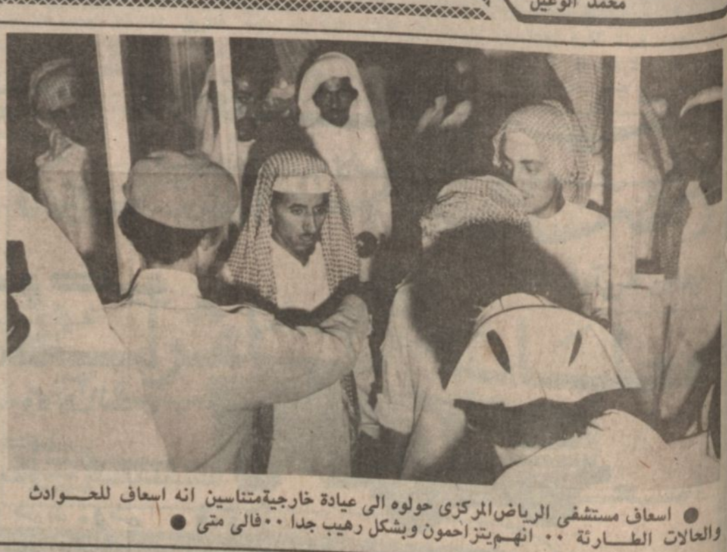
اسعاف مستشفى الرياض المركزي حولوه الى عيادة خارجية متناسين انه اسعاف للحوادث والاعلالت الطارئة .. انهم يتزاحمون ويشكل رهيب جدا .. فالى متى