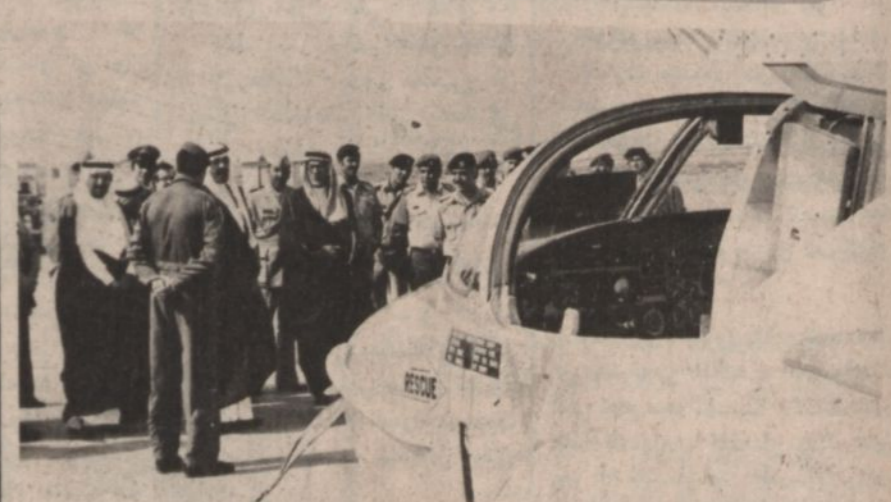
سمو النائب الثاني ورئيس الحرس الوطنى يستمع الى شرح عن تنظيم وتدريب القوات الاردنية .. والوفد المرافق لسموه

وفي ختام جولته في دول المواجهه كان لسموه لقاء مع القوات المسلحة الاردنية . حيث تفقد سموه القوات الجوية