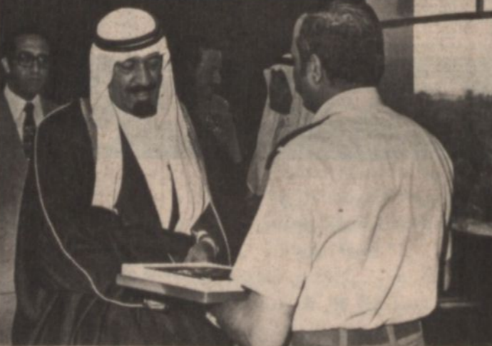
قائد قيادة الجيش الاردنى الشريف بن زيد يقدم درع القوات الاردنية هديه لسمو الامير عبد الله بن عبد العزيز