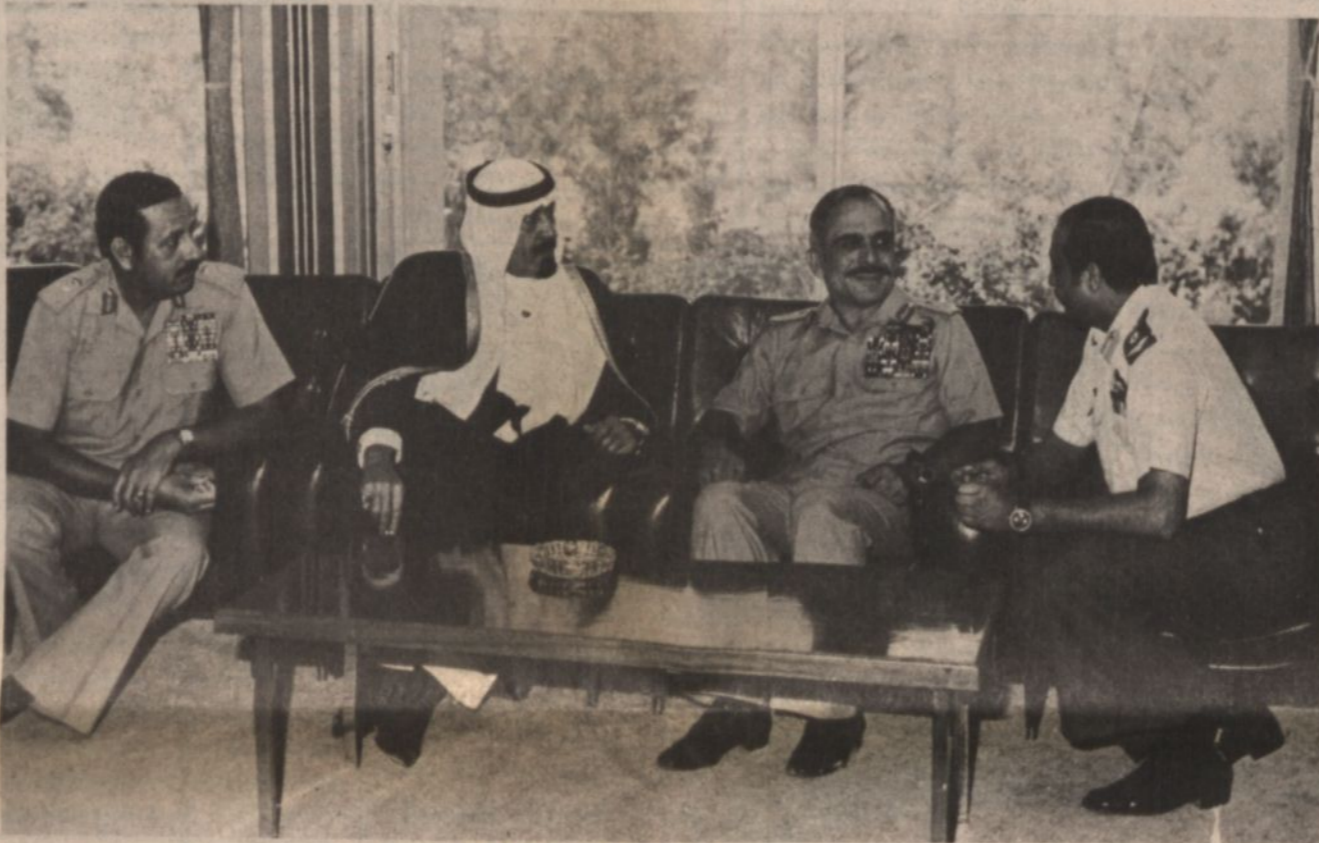
جلالة الملك الحسين وسمو الامير عبد الله في قاعة الاستقبال بقيادة الجيش الاردنى .

( الصور ) والتقى بأفراد القوات المسلحة وشهد عرضا عسكرية جوية وارضية .