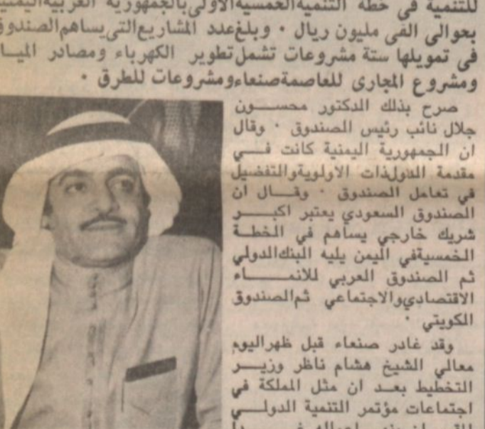
صن بك ذلك الدكتور محسون جلال نائب رئيس الصندوق ٠ وقال ان الجمهورية اليمنية كانت نسي مقمة الدولوات الأولية والتفضيل في تعامل الصندوق ٠ وقال ان الصندوق السعودي يعتبر اكبر شريك خارجي يساهم في الخطة الخمسية التي يوليها البنك الدولي ثم الصندوق العربي للتنمية الاقتصادية والاجتماعي ثم الصندوق الكويتي ٠ وقد غادر صنعاء قبل ظهر اليوم معالي الشيخ هشام ناظر وزير التخطيط بعد ان مثل الملكة في اجتماعات مؤتمر التنمية الدولي المقرر ان ينهي اعماله غدا ( البقية ص ١٥ )

لشمام ناظر: الخطة تجسد لاداء التنمية صنعا : ٣٠ نوفمبر - واس : تساهم الصندوق السعودي للتنمية في خطة التنمية الخمسية الأولى بالجمهورية العربية اليمنية بعوالي التي مليون ريال ٠ وبلغ عدد المشاريع التي تساهم الصندوق في تمويلها ستة مشروعات تشمل تطوير الكهرباء ومصادر المياه ومشروع الجاري للعاصمة صنعاء ومشروعات للطرق ٠