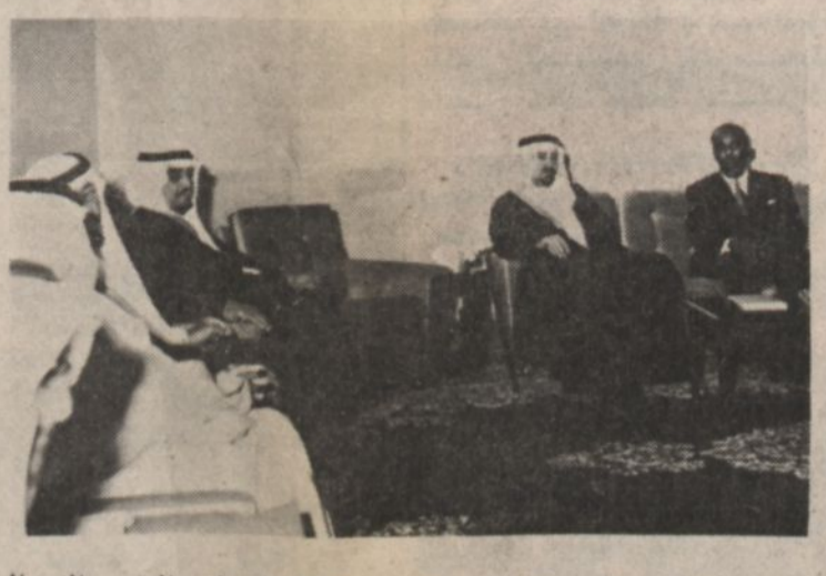
لقطة من الاجتماع الذي عقد بين جلالة الملك والرئيس الصومالي