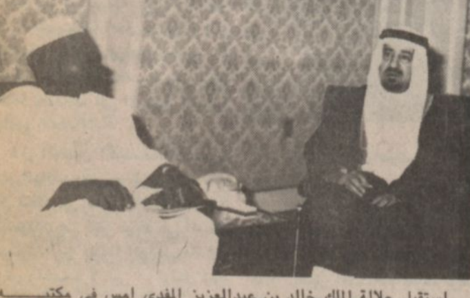
استقبل جلالة الملك خالد بن عبدالعزيز المفدى امس في مكتبه بالديوان الملكي الدكتور لانسانسايا فوجي رئيس وزراء غينيا والسيد موسى دنكته وزير الداخلية في غينيا

الامم المتحدة - ٣٠ نوفمبر - واس : ادانت اللجنة السياسية التابعة للجمعية العامة للأمم المتحدة من جديد اسرائيل لسياساتها وتصرفاتها التوسعية في الأراضي العربية المحتلة منذ عام ٦٧٠٠ طالبت الامم المتحدة بوضع حد لهذه التصرفات ٠٠ اصدرت اللجنة السياسية ثلاث قرارات في هذا الشأن ٠٠ يقضي القرار الاول بادانة تصرفات اسرائيل بضمها بعض اجزاء من الاراضي العربية واقامة المستوطنات الاسرائيلية عليها ٠