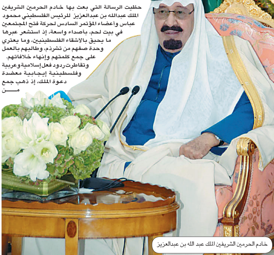
خادم الحرمين الشريفين الملك عبد الله بن عبدالعزيز

حظيت الرسالة التي بعث بها خادم الحرمين الشريفين الملك عبدالله بن عبدالعزيز للرئيس الفلسطيني محمود عباس وأعضاء المؤتمر السادس لحركة فتح المجتمعين في بيت لحم، بأصداء واسعة، إذ استشرع عبرها ما يحق بالأشقاء الفلسطينيين، وما يعترى وحدة صفهم من تشرد، وطالبهم بالعمل على جمع كلمتهم وإنهاء خلافاتهم. وتقاطرت ردود فعل إسلامية وعربية وفلسطينية إيجابية معضدة دعوة الملك، إذ ذهب جمع ممن