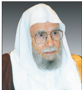
د. عبد الله التركي

تمنت الأمانة العامة لرابطة العالم الإسلامي عالياً المضامين الضافية التي احتوتها البرقية التي وجهها خادم الحرمين الشريفين الملك عبدالله بن عبد العزيز إلى الرئيس محمود عباس رئيس السلطة الوطنية الفلسطينية بمناسبة انعقاد المؤتمر السادس لحركة فتح، وصنفتها ضمن اهتمامه بفلسطين وشعبها، وفي ما يبذله من جهود لراب الصدع وتوحيد الصف بين الفصائل الفلسطينية، ودعت الفلسطينيين قيادة وشعباً إلى الاستفادة مما ورد في البرقية.