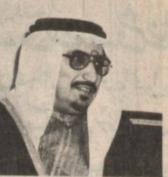
د : ال الشيخ

وسيت بموجب العقدين بناء خمس خزانات لسفط الياه ووحدة للضخ واكثر من ٢٥ وحدة شرب لاهالي ووحدة للناقلات واحواض لشرب الماشية.