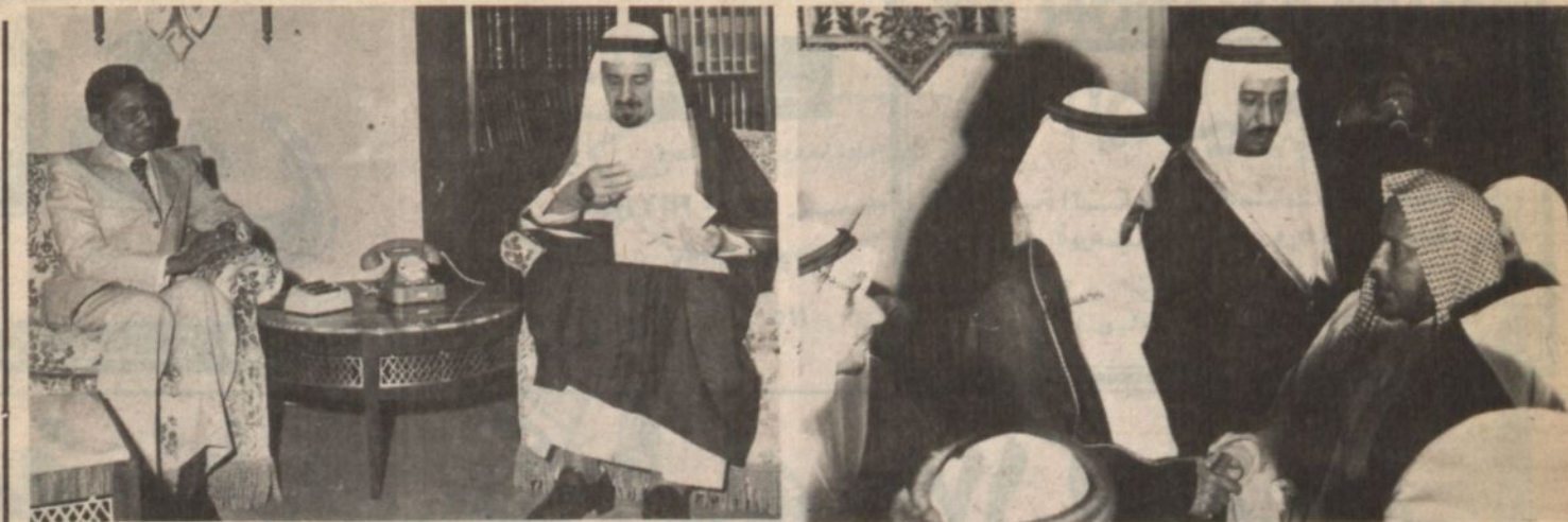
جلالة الملك اعظم يستقبل العشاء والمشايخ وجموع المواطنين وجلالته يستقبل وزير الشؤون الخاصة لرئاسة جمهورية السودان