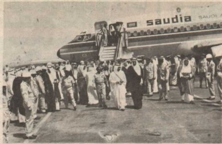
سموه لدى وصوله الى مطار الرياض امس