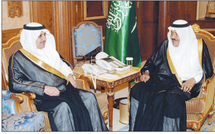
الأمير نايف مستقبلاً أمير منطقة تبوك البارحة في الرياض.

واس - الرياض استقبل صاحب السمو الملكي الأمير نايف بن عبد العزيز النائب الثاني لرئيس مجلس الوزراء وزير الداخلية، في مكتبه في وزارة الداخلية أمس، صاحب السمو الملكي الأمير فهد بن سلطان بن عبد العزيز أمير منطقة تبوك ومحافظي المنطقة الذين قدموا للسلام عليه وتهنئته بمناسبة تعيينه نائباً ثانياً لرئيس مجلس الوزراء.