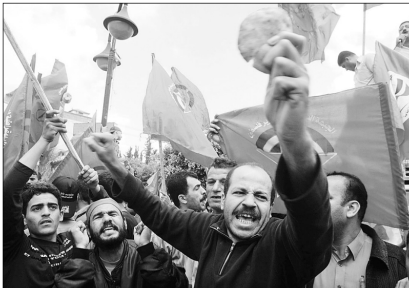
عمال فلسطينيون يرفعون الخبز خلال مظاهرة في مدينة غزة أمس ضد البطالة.

تظاهر الآلاف من العمال الفلسطينيين أمس وسط مدينة غزة في مناسبة يوم العمال العالمي الذي يحتفل به اليوم، بدعوة من قوى اليسار مطالبين برفع الحصار وإنهاء الانقسام. وردد المتظاهرون هتافات طالبوا فيها الرئيس الفلسطيني محمود عباس ورئيس الوزراء المقال إسماعيل هنية بالعمل على إنهاء الانقسام بين الحركتين، ورفع الحصار الإسرائيلي عن قطاع غزة، من بينها: 'يا هنية ويا عباس الوطن هو الأساس'. كما رفعوا لافتات كتب عليها 'أطفالنا يموتون بلا رحمة من الحصار والعدوان' و'لا للحصار لا للعدوان لا للانقسام'. وحمل المتظاهرون أدوات البناء والعمل وأرغفة من الخبز وأواني فارغة في إشارة إلى الفقر الذي وصلوا إليه بسبب نقص الوظائف واستمرار الحصار الإسرائيلي. وتحدث مركز الإحصاء الفلسطيني في بيان صحافي عشية الأول من مايو عن ٦٤٨ ألف عامل و٢٢٧ ألف عاطل عن العمل في الأراضي الفلسطينية عام ٢٠٠٨. وأضاف البيان أن نسبة البطالة في الأراضي الفلسطينية تسجل ارتفاعاً نسبتها ٢١٪ بين العامين ٢٠٠٧ و ٢٠٠٨.