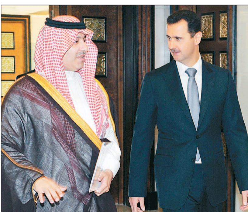
الأمير عبد العزيز بن عبد الله بن عبد العزيز مستشار خادم الحرمين الشريفين كما بدأ مع الرئيس السوري في دمشق أمس، حاملاً رسالة خطية من الملك عبد الله إلى الرئيس بشار الأسد.

علي عبد - دمشق تسلم الرئيس السوري بشار الأسد رسالة خطية من خادم الحرمين الملك عبد الله بن عبد العزيز حملها مستشاره عبد العزيز بن عبد الله بن عبد العزيز. وأكد الجانبان خلال اللقاء في دمشق أمس على «ضرورة مواجهة التهديدات الإسرائيلية المتكررة ضد دول المنطقة واعتداءاتها على الشعب الفلسطيني في الأراضي الفلسطينية المحتلة من خلال توحيد المواقف ومواصلة العمل الجاد لتعزيز التضامن العربي وتفعيل العمل العربي المشترك». كما تناول اللقاء التطور الذي تشهده العلاقات السعودية السورية وأهمية التنسيق بين البلدين الشقيقين والأنعكاسات الإيجابية لذلك على القضايا التي تهم الأمة العربية وعلى أمن واستقرار المنطقة. يشار إلى أن الرئيس الأسد تلقى من خادم الحرمين رسالتين في مطلع شهري فبراير (كانون الثاني) ومارس (آذار) الماضيين حول تعزيز العلاقات بين البلدين والتطورات في المنطقة.