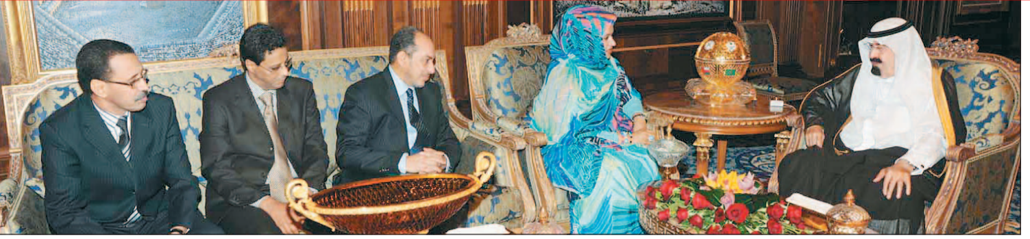
خادم الحرمين الشريفين لدى استقباله البارحة وزيرة الشؤون الخارجية الموريتانية النامية بنت مكناس والوفد المرافق لها في قصره في الرياض.

للشؤون التنفيذية، صاحب السمو الملكي الأمير عبد العزيز بن عبد الله بن عبد العزيز مستشار خادم الحرمين الشريفين، سفير خادم الحرمين الشريفين لدى موريتانيا سعود بن عبد العزيز الجابري، وسفير موريتانيا لدى المملكة محمد محمود ولد عبد الله ولد بيه.