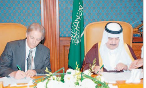
الأمير فهد بن عبد الله يوقع العقد مع الشركة المنفذة في الرياض أمس.

تهدف لتوفير أنظمة حديثة تتوافق مع استراتيجية الهيئة لتطوير قطاع المطارات في المملكة، ومنها: تطوير أنظمة السلامة لتواكب نمو الحركة الجوية في المجال الإقليمي للمملكة، وتلقي الزيارة المضطربة في الحركة الجوية في منطقة الشرق الأوسط. وأشار مساعد وزير الدفاع لشؤون الطيران المدني إلى أن هذه الخطوة ستوفر نقلة نوعية في مجال الأنظمة وانسجامها مع المرحلة المقبلة، إذ سيوفر العقد الاحتياجات الخاصة بالمملكة، بحيث تكون مطابقة لأقصى حد ممكن للمعايير والممارسات التي توفى بها المنظمة الدولية للطيران المدني (إيكاو). ويتضمن العقد، عمل الشركة على إعداد برامج لأنظمة الطيران المدني والوسائل الإرشادية الخاصة لتدريب مفتشي الهيئة، إضافة إلى إعداد برنامج نظام إدارة السلامة الخاص وبرنامج تدقيق السلامة الخاص بالهيئة والمواصفات التشغيلية الخاصة بالمشروع.