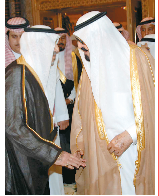
خادم الحرمين الشريفين مستقبلاً في الرياض البارحة الأمير عبد الله بن خالد بن عبد العزيز.

وثمن خادم الحرمين الشريفين الملك عبد الله بن عبد العزيز مآثر الملك خالد بن عبد العزيز برحمته الله وما قدمه من جهود لخدمة دينه ووطنه وشعبه، سائلاً الله أن يجعل ذلك في ميزان حسناته، وأن يسكنه فسيح جنته. وأعرب الملك عن تقديره وشكره لصاحب السمو الملكي الأمير عبد الله بن خالد بن عبد العزيز رئيس مجلس أمناء مؤسسة الملك خالد الخيرية، صاحب السمو الملكي الأمير فيصل بن خالد بن عبد العزيز أمير منطقة عسير نائب رئيس مجلس أمناء المؤسسة، وصاحب السمو الملكي الأمير محمد بن عبد الله بن خالد بن عبد العزيز لهم في مزرعته في الجنادرية البارحة، بمناسبة انعقاد الندوة العلمية لتاريخ الملك خالد بن عبد العزيز، ومعرض خالد