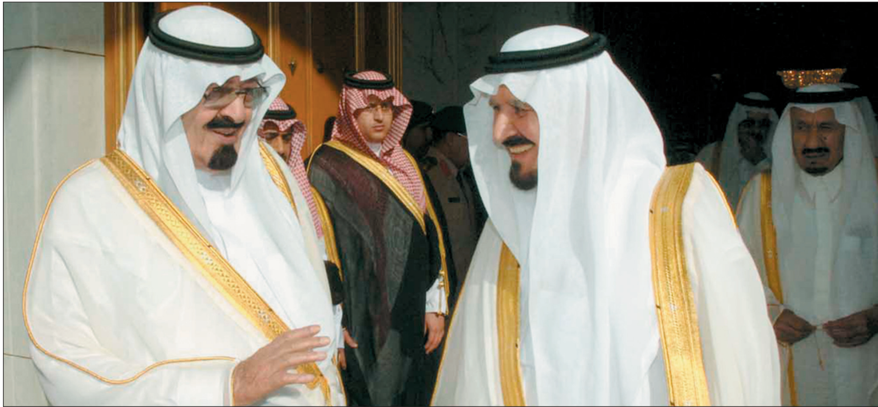
خادم الحرمين الشريفين وولي العهد لدى لقائهما الأمراء والمسؤولين في الرياض. (واس)

وزاد الأمير سلطان: «لا شك أن هذه الدعوة الناجحة للحوار الجاد بين أبناء الوطن الواحد قد تبعتها دعوة عالمية أطلقها الملك عبد الله بن عبد العزيز للاجتماع بين علماء ومفكري العالم الإسلامي في المؤتمر الإسلامي العالمي للحوار في رحاب مكة المكرمة عام ١٤٢٩هـ، الذي مهد لمبادرة خادم الحرمين الشريفين بين أتباع الديانات والثقافات وخرجها عالمياً ووجدت لها صدى واسعاً وتأييداً كبيراً، إذ انتقل الحوار إلى عواصم ومدن عالمية من مدريد إلى نيويورك وتبنته الأمم المتحدة ثم في جنيف وفيينا وغيرها من المدن والدول التي كانت محطات مهمة في مسيرة الدعوة العالمية للحوار والتعايش بين الأمم والثقافات».