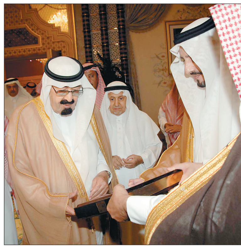
الملك يتسلم كتاب باب الكعبة وكتاب ملامح خالدة من الأمير عبدالله بن خالد بن عبدالعزيز، والأمير فيصل بن خالد بن عبدالعزيز لدى استقبالهما في منزلهما في الجندرية البارحة.