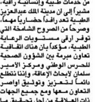
الأمير سلطان بن سلمان

الرياض والرئيس الأعلى مركز الأمير سلطان لأبحاث الإعاقة يوم الأحد الماضي انطلاقاً للبرنامج الوطني الشامل للكشف المبكر على جميع حديثي الولادة، تجسد جميع أهداف البرنامج من قبل الشؤون الصحية بالحرس الوطني لأهمية هذا البرنامج الذي سيساعد يأن الله في التغلب على الكثير من الأمراض النسبية للإعاقة.