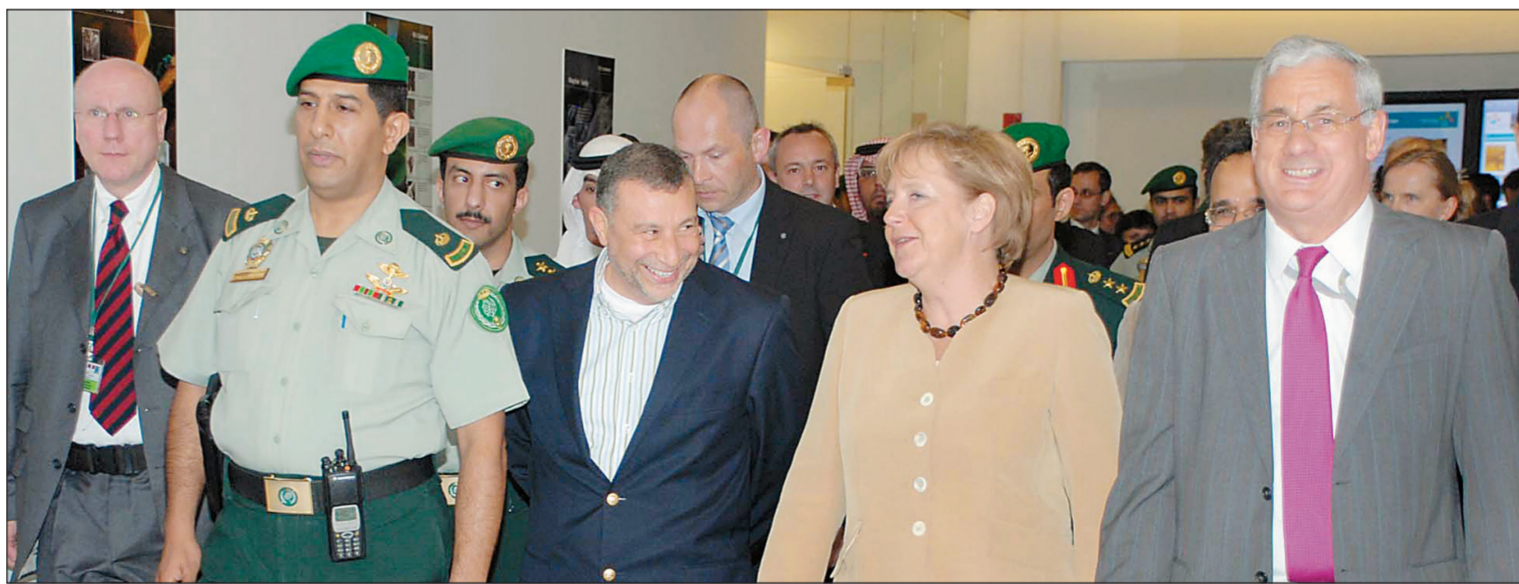
أنجيلا ميركل لدى زيارتها جامعة الملك عبد الله للعلوم والتقنية في ثول أمس الأول.

وأضافت أنها أوضحت الشكر لخادم الحرمين الشريفين على قيام القوات المسلحة بتحرير فئتين ألمانيّتين كانتا محتجزتين رهينتين في اليمن. هذا، وتناول اللقاء بين