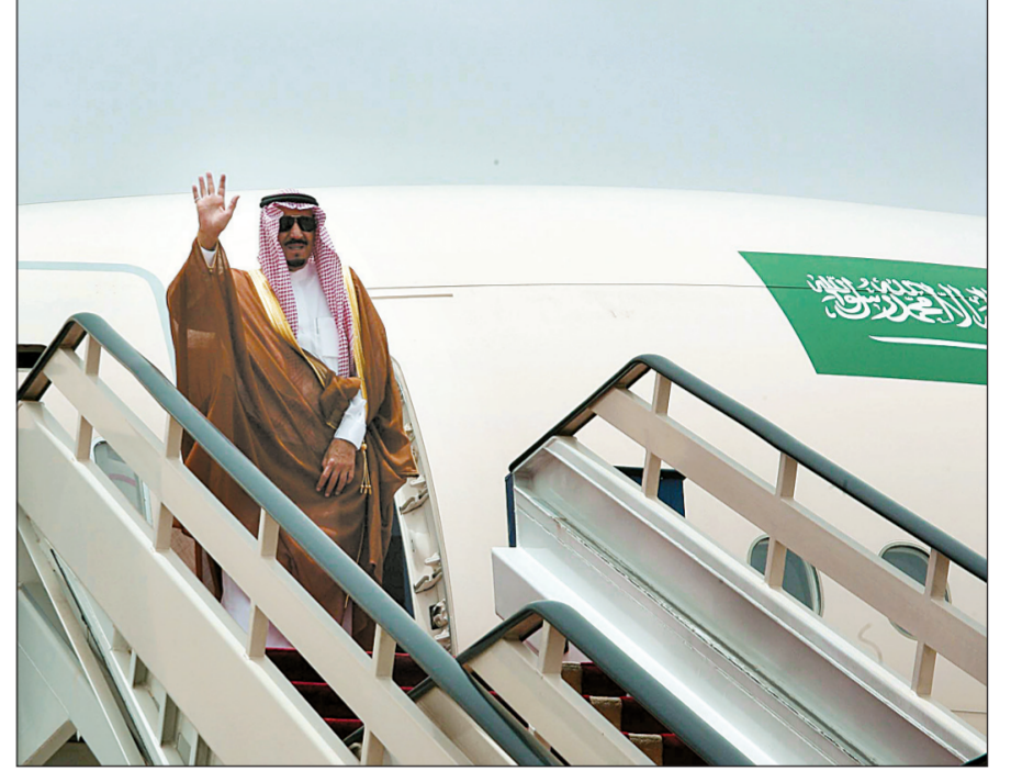
الأمير سلمان بن عبد العزيز ملوحاً لمودعيه لدى مغادرته الرياض إلى النرويج أمس.

السمو الملكي الأمير سلمان بن سلطان بن سلمان بن عبد العزيز. كما كان في وداع سموه الشيخ صالح آل الشيخ رئيس المحكمة الجزئية في الرياض، وكيل وزارة الداخلية الدكتور أحمد السالم، قائد قاعدة الرياض الجوية اللواء الطيار الركن عبد اللطيف بن عبد الله الشريم وعدد من المسؤولين من مدنيين وعسكريين.