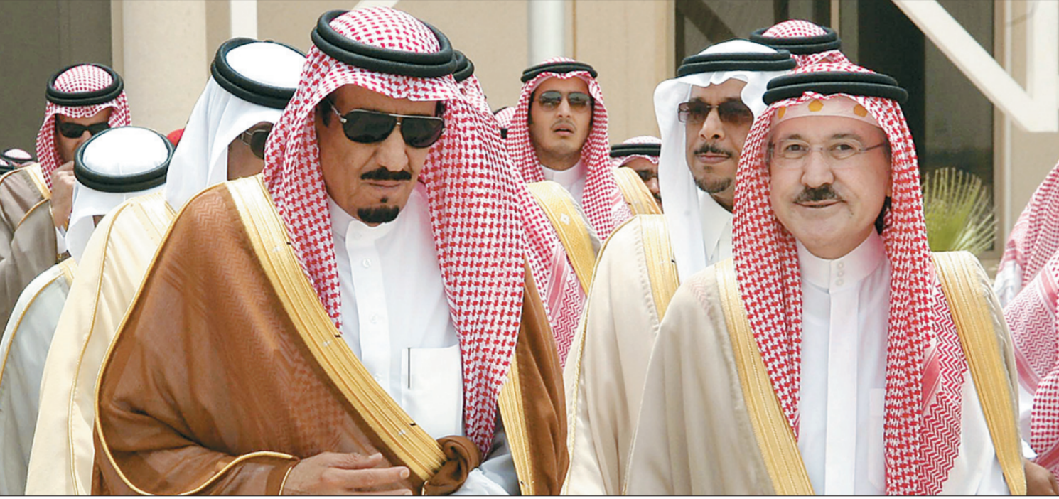
أمير الرياض وفي وداعه الأمير سمام بن عبد العزيز في الرياض أمس.