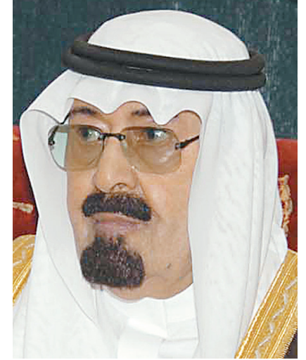
الملك عبدالله بن عبدالعزيز