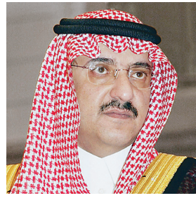
الأمير محمد بن نايف المستفيدين بالمركز بالشفافية والحوار الهادف في كل الجوانب الشرعية، النفسية، الاجتماعية.

البرنامج التاريخي بواقع خمس ساعات أسبوعياً. - برنامج الفن التشكيلي بواقع خمس ساعات أسبوعياً. - البرنامج الرياضي بواقع اثنتي عشرة ساعة أسبوعياً. وينظم المركز للمستفيدين أسبوعياً ثقافية أسبوعياً يتم فيها استضافة عدد من العلماء وأساتذة الجامعات في المجالات الشرعية والاجتماعية والنفسية وتطوير الذات وإدارة المشاريع الصغيرة والاستشارات المهنية، ويخضع المركز للمستفيدين النوازل الهاتفي مع اهاليهم ونوهم بالإضافة إلى الزيارات العائلية التي تتخللها خلوات شرعية للمزوجين منهم، كما يوفر المركز للمستفيدين الذين يتم إطلاق سراحهم المساندة الاجتماعية والنفسية التي تشمل العثور على عمل ومواصلة التعليم، ويساند المركز المستفيدين عند إطلاق سراحهم بمعونة مالية تبلغ عشرة آلاف ريال لكل مستفيد.