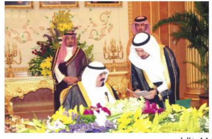
الأمير عبدالله خلال ترؤسه المجلس