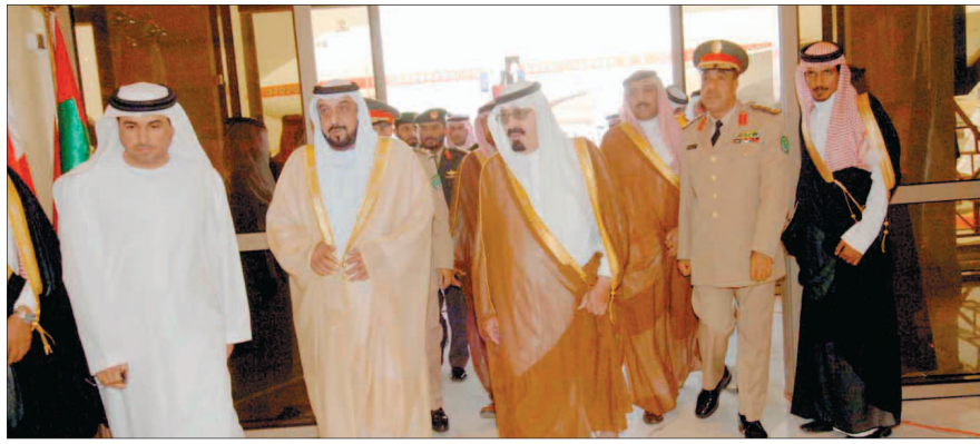
المليك لدى استقباله الشيخ خليفة بن زايد رئيس دولة الامارات

المشترك على جميع المستويات لتحقيق المزيد من المنجزات التي تلبى تطورات وطموحات شعوبنا في الاستقرار والازدهار لشؤون مجلس الوزراء بسلطنة عمان عن سعاداته بالمشاركة في القمة التشاورية نيابة عن صاحب السمو الشيخ صباح الاحمد الجابر الصباح امير دولة الكويت عن سعاداته بالمشاركة في هذه القمة وقال «يطيب لي وقد وصلنا الى بلدنا الشقيق المملكة والوفد المرافق أن أعرب عن سعاداتي بمشاركة أشقائي قادة دول المجلس في اللقاء التشاوري الثامن والذي يأتي انعقادها في ظروف بالغة الدقة وفي ظل تطورات سريعة ومتلاحقة الامر الذي يضفي على لقائنا الاخوي المبارك أهمية مضاعفة ويحتتم علينا جميعا مواصلة العمل الدؤوب لتفعيل عملنا الخليجي المشترك ودفع مسيرة العمل المشترك لمجلس التعاون لدول الخليج العربية نحو آفاق ارحب لتحقيق المزيد