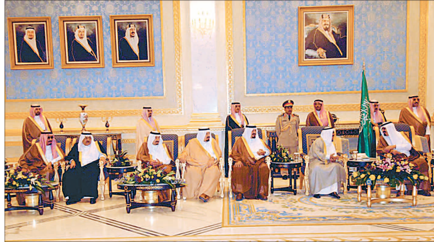
خادم الحرمين الشريفين لدى اجتماعه مع امير دولة الكويت

المجالات المختلفة وفي مقدمتها التعاون الامني في ظل الجهود المبذولة لمكافحة الارهاب. وقالت مصادر مقربة من القمة إن الزعماء بحثوا الوضع في العراق وعبروا عن قلقهم ازاء التدهور الامني فيه وما يمكن أن يفرضه من تداعيات على دول وشعوب المنطقة في حين استعرضوا تطورات الوضع في الاراضي الفلسطينية المحتلة وسبل دعم حكومة حركة حماس لاسيما وأن توفير الدعم هو لرفع معاناة الشعب الفلسطيني. وأشارت المصادر الى أن القادة بحثوا في الملف النووي الايراني والجدل الدائر بين طهران والعواصم القريبة بشأنه مؤكدين على ضرورة التوصل الى تسوية سلمية بعيدا عن العمل العسكري لأن آثاره ستكون خطيرة للغاية لكافة الاطراف.