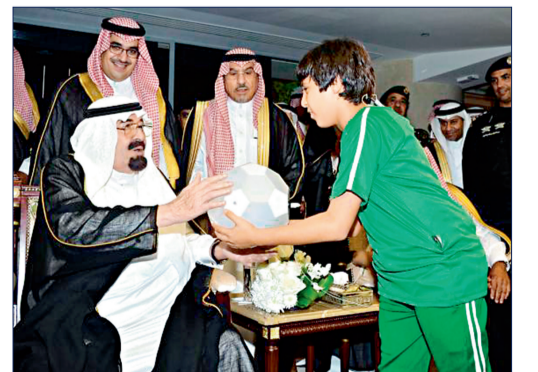
الملك عبدالله -يرحمه الله- خلال افتتاح ملعب الجوهرة.

تستدعي الذاكرة صوراً لفقيد الأمة وزعيمها الملك عبدالله بن عبدالعزيز -يرحمه الله-، مليحة بغفويته ومعبرة عن إنسانيته الصادقة مع أفراد حال بقية المواطنين والمقيمين على هذه الأرض، ويسترجع تلك الذكرى قائلاً أتألم كثيراً وأنا أتذكر تلك اللحظات ولا أمك إلا الدعاء له بالرحمة والغفران، كانت إنسانيته معي وتعامله بغفوية دافعا لي لكسر التوتر الذي صاحبني حينها وأنا في حضرة الملك (يرحمه الله)، قدم لي قلمه هدية ولم أشعر بوجود أي حاجز بيني وبينه، كانت هذه المبادرة الصادقة منه تأكيداً على نواضعه مع شعبه وحبه لهم، رحمه الله رحمة واسعة حملنا في قلبه وسيبقى في قلوبنا.