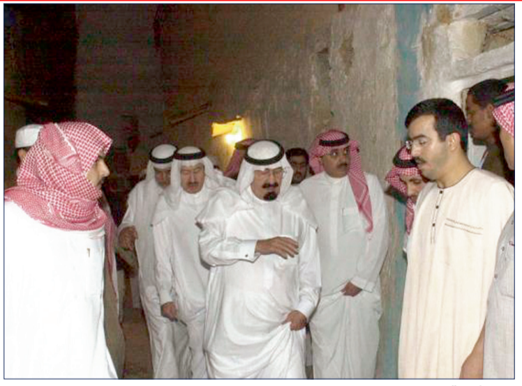
الملك الراحل خلال زيارته لحي منقوحة في الرياض.

تلمس خادم الحرمين الشريفين الملك عبدالله بن عبدالعزيز -يرحمه الله- أحوال الفقراء والمساكين قبل أن يتولى مقاليد الحكم وخصوصاً القاطنين في الأحياء القديمة والشعبية وزيارته الشهيرة لحي منقوحة في