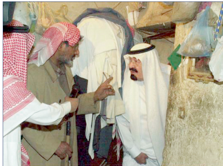
الملك الراحل خلال زيارته لحى منفوحة في الرياض.

من نعزي فيك يا وافي الضلال أمتك ولا الأمم كل الأمم الأكيد أنك تعيش ولا تزال في قلوب الناس يا رأس الهرم مواطن