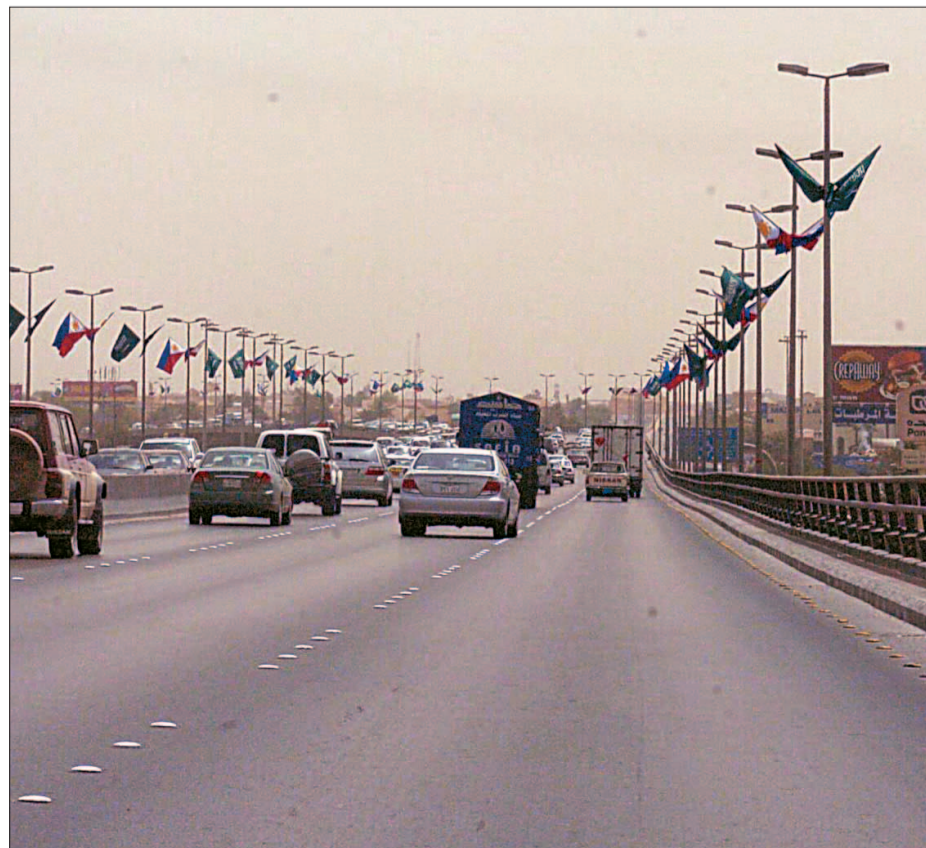
الاعلام السعودية والفلبينية تزين شوارع الرياض احتفاءً بقدم الرئيسة ارويو

وقال ان الشراكة السعودية مع الفلبين تحظى باهتمام كبير من قبل الدولة كون المملكة تقدم للفلبين المنتجات البترولية وكيماوية نظراً لان الفلبين من اعلى الدول نسبة في النمو وبها فرص استثمارية كبيرة فمن الطبيعي ان يكون لها الاهتمام والاولوية في التعاملات الاقتصادية واستدرك قائلاً انه لا يوجد خلال هذه الزيارة اية اتفاقيات اقتصادية سيتم توقيعها وسوف تقتصر على المناقشات ومن بينها عملية استخدام العمالة المدربة والاستفادة من اصحاب الخبرات والمهارات.