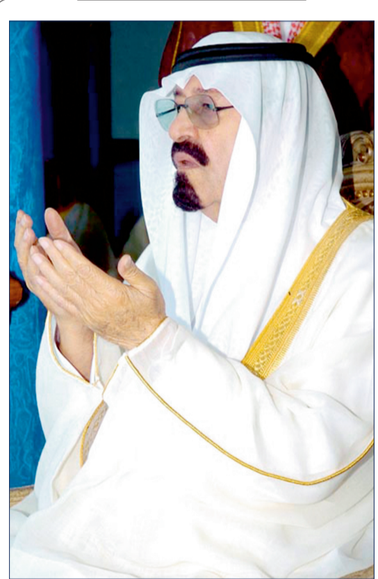
من نعزي فيك يا وافي الضلال أمتك ولا الأمم كل الأمم الأكيد أنك تعيش ولا تزال في قلوب الناس يا رأس الهرم مواطن

أولى الملك الإنسان خادم الحرمين الشريفين الملك عبدالله بن عبدالعزيز -رحمه الله- الأعمال الإنسانية جل اهتمامه في الداخل والخارج من خلال إنشاء مؤسسة خادم الحرمين الشريفين الملك بن عبدالعزيز آل سعود العالمية للأعمال الإنسانية والتي نفذت مشاريع إنسانية كبيرة ومنها مشروع جمعية «كلانا» الخاص بمرضى الكلى في جميع مناطق المملكة لعشرات الآلاف من مرضى الكلى ومرضى السكري المهديين بتفلسص وفئات الكلية لديهم في الأعوام القادمة، حيث