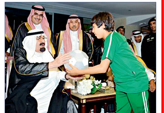
الملك عبدالله -يرحمه الله- خلال افتتاح ملعب الجوهرة.

شعبه، وهذه الصورة تحمل واحداً من أكثر المشاهد التي ترسخت في عقول أبناء هذا الوطن وأذهانهم، حين قدم رحمه الله قلمه الشخصي هدية للطفل فيصل الغامدي الذي يبكي اليوم رحيل قلبه ومعبرة عن إنسانيته الصادقة مع أفراد حال بقية المواطنين والمقيمين على هذه الأرض، ويسترجع تلك الذكرى قائلاً أتألم كثيراً وأنا أتذكر تلك اللحظات ولا أمك إلا الدعاء له بالرحمة والغفران، كانت إنسانيته معي وتعامله بغفوية دافعا لي لكسر التوتر الذي صاحبني حينها وأنا في حضرة الملك (يرحمه الله)، قدم لي قلمه هدية ولم أشعر بوجود أي حاجز بيني وبينه، كانت هذه المبادرة الصادقة منه تأكيداً على نواضعه مع شعبه وحبهم لهم، رحمه الله رحمة واسعة حملنا في قلبه وسبقني في قلوبنا.