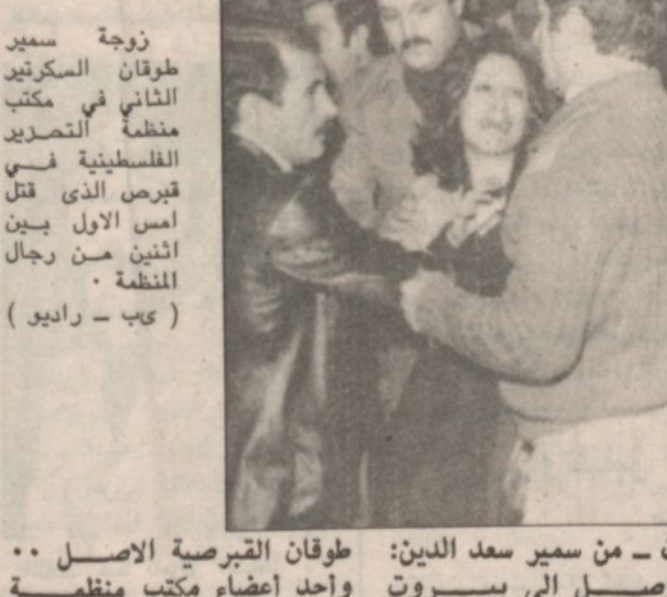
زوجة شهيد طوفان السرقيدي الثاني في مكتب منظمة التحرير الفلسطينية في قبرص الذي قتل امس الاول بين اثنين من رجال المنظمة .

اللبنانية تنشره اليوم ، باحتمال سقوط حكومة بيفن وتشكيل حكومة جديدة على الانتخابات تجري قبل وقتها . وقال في ختام تصريحه : وفي هذه اللحظة سنبدأ في تحقيق تقدم نحو التوصل الى تسوية عادلة . واكد اكينز انه يتعين على الغرب ان ينظر بمزيد من الجدية الى التهديد بنسف حقول بترول ( البقية صفحة ١٥ )