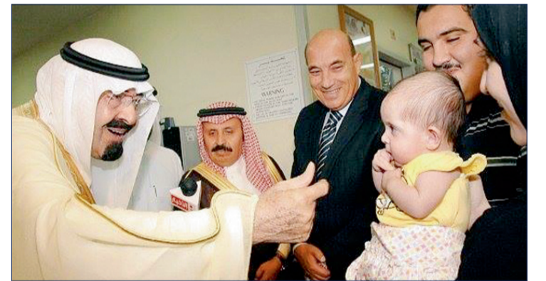
الملك عبدالله -يرحمه الله- يداعب أحد الأطفال.