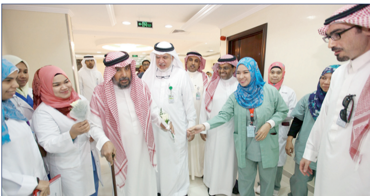
منسوبو المركز يستقبلون أحد المرضى.

وجد مرضى الكلى منه -يرحمه الله- كافة التسهيلات بإنشاء مراكز غسيل الكلى المجانية بمواصفات عالمية قل ما نجدتها في العالم. هذا المشروع الإنساني وبتكلفة كبيرة تجاوزت ٤٠٠ مليون ريال كان بمثابة البلمس لهم وأعانهم على معاناتهم اليومية. وأنشئت في زمن قياسي، حيث انطلاقة تلك المراكز في مرحلتها الأولى من العاصمة الرياض بفرعين ومن ثم مكة وجدة بواقع ٤٧٥ جهازاً للغسيل، فيما سيتم افتتاح مراكز المدينة المنورة، حائل، رفحاء، والقصيم خلال الفترة القادمة. وشدد -رحمه الله- على رعاية طبية فائقة لهم على مدار الساعة.