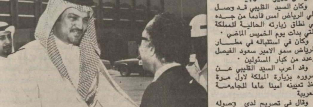
الملك خالد بن عبد العزيز يستقبل الأمين العام للجامعة العربية شاذلى القايبى في الرياض.

الرياض - ١٠ و١٠ استقبل جلاله الملك خالد بن العزيز المفدى في مقر اقامه جلالتة في التمامة في الساعة الواحدة بعد ظهر امس السيد الشاذلى القايبى الامين العام للجامعة العربية الذي يسزور المملكة حاليا .. وحضر المقابلة صاحب السمو الملكي الامير فهد بن عبد العزيز ولي العهد نائب رئيس مجلس الوزراء وصاحب السمو الملكي الامير عبدالله بن عبد العزيز النائب الثاني لرئيس مجلس الوزراء ورئيس الحرس الوطني وصاحب السمو الملكي الامير سعود الفيصل وزير الخارجية .. وكان السيد القايبى قد وصل الى الرياض امس قادما من جنده في نطاق زيارته الحالية للمملكة التي بدأت يوم الخميس الماضي .. وكان في استقباله في مطار الرياض سمو الامير سعود الفيصل وعدد من كبار المسؤولين .. وقد اعرب السيد القايبى عن سروره بزيارة المملكة لأول مرة منذ تعيينه امينا عاما للجامعة العربية .. وقال في تصريح لدى وصوله انه يتطلع الى مقابلة جلالته الملك خالد بن عبد العزيز للاستشارة يارائه فيما يهم الجامعة العربية وعلاقات الدول العربية بالدول الاجنبية .. كما اعرب عن سروره بهذه الفرصة التي ستتيح له الاجتماع مع صاحب السمو الملكي الامير فهد بن عبد العزيز ولي العهد ونائب رئيس مجلس الوزراء وصاحب السمو الملكي الامير سعود الفيصل وزير الخارجية .. وقال ان محادثاته في المملكة ستتناول كل القضايا التي تمه الدول العربية ووصفة خاصة موضوع تطوير علاقات الدول العربية بالدول الافريقية والاوربية .. وتأتي زيارة السيد القايبى للمملكة في نطاق جولته الحالية في عدد من الدول العربية ..