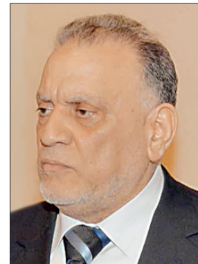
د. أحمد عمر هاشم

الشعب المصري باكملته تجاه حكيم العرب الذي وقف بجانب مصر ودافع عنها بكل قوة وحزم، وأن ما اتخذته قيادة المملكة خاصة خادم الحرمين الشريفين من خطوات مهمة تجاه مصر لتعزيز الأمن القومي العربي، تعكس رؤية بعيدة المدى وإدراكاً حقيقياً من جانب خادم الحرمين الشريفين لأهمية الدور المصري تجاه الحفاظ على الأمن والاستقرار في المنطقة»، مضيفاً أن «وقوف الملك عبدالله بجانب مصر أدى لبروز حالة جديدة وحقيقية من التضامن العربي لمواجهة التحديات والمخاطر التي كانت تستهدف المنطقة العربية ومنها مصر».