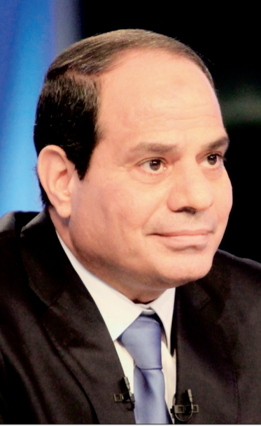
الرئيس المصري عبدالفتاح السيسي

من الأحداث التاريخية التي مرت بها مصر، وهو الاقتراح الذي حظي بموافقة المجلس الأعلى. وأضاف أن مصر ستظل تذكر لخادم الحرمين الشريفين مواقفه الثابتة إزاء مصر وشعبها، متطلعة دوماً إلى تعزيز التعاون مع المملكة لتحقيق صالح الأمتين العربية والإسلامية.