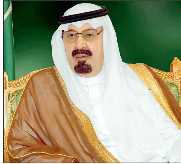
الملك عبدالله بن عبدالعزيز

وأكد أن ما أنجزه المجلس على مدى دوراته المنصرمة جاء بفضل الله