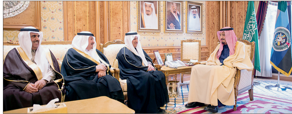
ولي العهد مستقبلاً رئيس مجلس الإدارة وكبار مسؤولي الشركة الوطنية للنقل البحري أمس في الرياض.