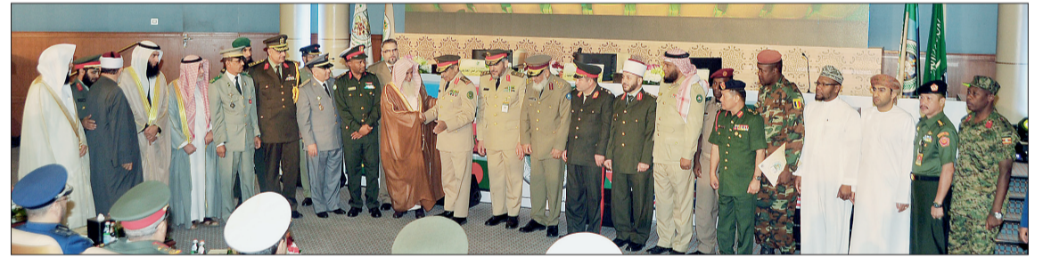
جانب من العسكريين حضور حفل الافتتاح.