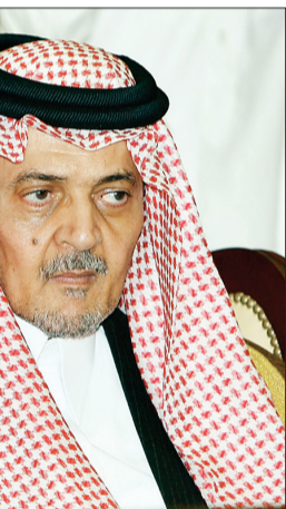
الأمير سعود الفيصل

أفاق أرحب في المنظومة الإقليمية والدولية، وتشكيل قوة اقتصادية وسياسية متسقة في عملها وترسم مستقبلها من خلال استراتيجية واضحة المعالم والرؤى، وكذلك التأكيد على مبادئ ميثاق دول مجلس التعاون الخليجي الذي يطالب بحفظ هذا الكيان من أي انتهاك، والمساهمة في حماية دوله من أي مخاطر تتعرض لها، ويجسد الرغبة الأكيدة التي تحرص المملكة على تحقيقها بين دول المجلس في صياغة علاقة متكاملة ومترابطة تخدم الطموحات وتحقق القرارات التي اتخذها قادة دول المجلس في قممهم واجتماعاتهم. وأضاف: وعلى الصعيد العربي، رسمت المملكة سياستها الخارجية، وفق رؤية تهدف إلى وحدة الصف العربي، وترميم ما يشوبه من خلافات، والمساعدة على تجاوز المشاكل التي تعيشها بعض البلاد التي عانت من مشاكل داخلية من خلال مد يد العون لها، والإسهام في تصميد جراحها، وفي حل خلافاتها بما يحقق لها الأمن والأمان والحياة الكريمة. وقال: استمرت المملكة في دعمها للقضية الفلسطينية، لتحقيق الحل العادل والدائم والشامل المتشود وعلى أساس مبادرة الملك عبدالله بن عبدالعزيز التي أصبحت المبادرة العربية للسلام، وتشكيلها قوة اقتصادية إقليمية ودولية، تمثل في مكانة المملكة ودخولها ضمن دول مجموعة العشرين، التي ترسم السياسة الاقتصادية للعالم، وأصبحت تحتل مرتبة متقدمة في اقتصاديات الدول الناشئة، وهي انعكاس للمنجزات التي تحققت على المستوى الداخلي، والنمو الكبير الذي خطط له البلاد بقيادة خادم الحرمين الشريفين.