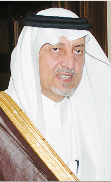
الأمير خالد الفيصل