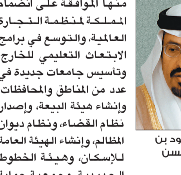
الأمير فهد بن سلطان