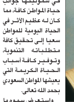
الأمير محمد بن ناصر

في شموليتها جوانب حياة المواطن كافة، مما كان له عظيم الأثر في الحياة اليومية للمواطن سعياً إلى تحقيق كافة متطلباته التنموية، وتوفير كافة أسباب الحياة الكريمة التي يعيشها المواطن السعودي بحمد الله تعالى. واستعرض سموه ما تحظى به منطقة جازان من اهتمام متواصل ورعاية دائمة من قبل خادم الحرمين الشريفين الملك عبدالله بن عبدالعزيز آل سعود - حفظه الله - وحكومته الرشيدة، الأمر الذي انعكس بشكل مباشر على مسيرة العمل التنموي في المنطقة، وحققت قفزات تنموية سابقة الزمن، لتختصر المسافات طموحا نحو تحقيق كافة متطلبات التنمية والتي كان آخرها صدور أمره الكريم بتأميم ثلاث عبارات لنقل البضائع ومواد البناء والمستلزمات الاستهلاكية بين ميناءي جازان وفرسان بما يخدم التنمية والتطوير في جزر فرسان، وأشار إلى ما يتم اعتماده سنويا من مشروعات تنموية لمنطقة جازان تشمل كافة محافظات ومراكزها وقراها في مجالات خدمية وتنموية متنوعة، تعزز اهتمام الملك المفدى - رعاه الله - بمواصلة مسيرة العمل والتطوير في هذه المنطقة الغالية، مؤكداً عمل الجميع بكل جهد وإخلاص لله تعالى لتحقيق طموحات وأمال القائد العظيم.