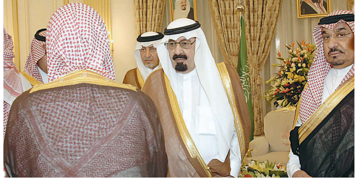
الملك عبدالله لدى استقباله المفتي العام والعلماء والمشايخ في قصره بالطائف