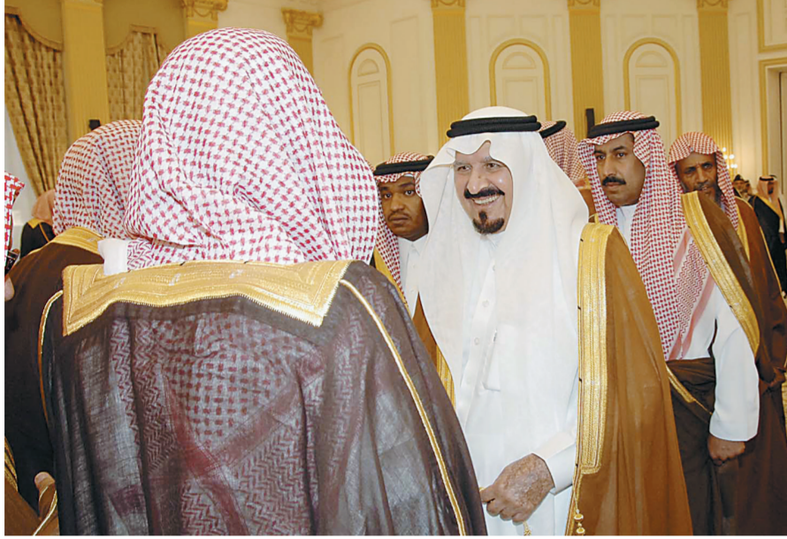
ولي العهد خلال الاستقبال