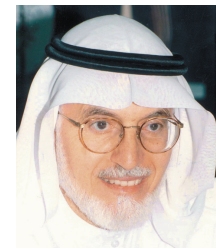
د. عبدالله نصيف

نائب رئيس مركز الملك عبدالعزيز للحوار الوطني الدكتور عبدالله عمر نصيف أكد أن دعوة خادم الحرمين للحوار تنطلق من دور المملكة إلى إرساء قواعد الحوار والتفاهم مع الدول والثقافات والأديان موضعاً أن هذه الدعوة أضافت لمسيرة الحوار بعداً جديداً، وهو استخراج ما في الأديان من مبادئ أخلاقية ودينية تساعد على توطيد الأخوة والسلام في العالم وإيجاد التعاون لكي تتحقق للإنسان إنسانيته خاصة أن العالم أصبح قرية واحدة فلا يتم هذا الأمر إلا بالتفاهم والتعاون والمحبة.