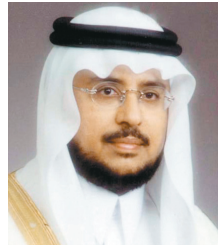
د. عبدالرحمن الزيد

الأمين العام المساعد لرابطة العالم الإسلامي لشؤون المساجد الدكتور عبدالرحمن الزيد أكد أن اهتمام خادم الحرمين الشريفين -وفقه الله- بالحوار ودعوة بلدان العالم وشعوبها إلى اتخاذ وسيلة للتفاهم والتعايش وتحويل النداء من أجل تفاهم الأمم عن طريق الحوار إلى واقع ميداني ومهام عملية لتأصيل مفهوم الحوار وأهدافه ووضع برامجه لتتخطى بعد ذلك أعمال الحوار في ندوات ومؤتمرات عالمية تشارك فيها الدول والمنظمات والشعوب المختلفة مبيناً أن النظرة الثاقبة لخادم الحرمين الشريفين تلمست حاجة الشعوب الإنسانية وهذا هو منطلقه في الدعوة إلى الحوار ورعاية مناشاة ولقاءاته ومؤتمراته وبرامجه ومهامه.