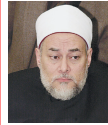
د. علي جمعة

مفتي مصر الدكتور علي جمعة أكد أن خادم الحرمين الشريفين يؤكد بدعوته للحوار على النهج الإسلامي الصحيح الذي تسير عليه المملكة لنشر ثقافة التسامح مع الآخر في مختلف أنحاء العالم مشيراً إلى أن الحوار والتعارف بين الأمم وبين أتباع الديانات السماوية من سنن الله تعالى في الكون وأن الإسلام دعانا إلى التعاون مع الآخر لتحقيق النفع والخير للبشرية مبيناً أن الحوار هو الذي يقود إلى معرفة الحقيقة والتعرف على الآخر عن قرب وينتج الفرصة إليه أيضاً ليعرف حقيقة الدين الإسلامي الحنيف.