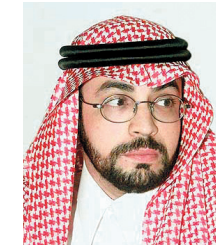
د. توفيق السديري

وكيل وزارة الشؤون الإسلامية لشؤون المساجد والدعوة والإرشاد الدكتور توفيق السديري أكد أن الدعوة الكريمة للحوار التي أطلقها خادم الحرمين الشريفين -حفظه الله- هي بداية الطريق للنقلة المطلوبة ولكي تبدأ الأمة الإسلامية بوضع أقدامها على الطريق الصحيح بين الأمم وأوضاع أن الوقوف أمام تجربتنا السابقة وترائنا فيما يتعلق بالحوار ودراسة واقعا خطوة مهمة لاستشراف آفاق المستقبل. تعقبها خطوات للبدء في نقلة جذرية بالحوار ترتكز فيها على أساس شرعي صلب مضيئاً بقوله إن ما نراه اليوم من اهتمام في مختلف الأوساط الإسلامية بالحوار إدراك لأهميته وفي مقدمة ذلك الدعوة الكريمة التي أطلقها خادم الحرمين الشريفين.