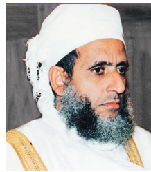
الشيخ أحمد الخليلي

المفتي العام لسلطنة عمان الشيخ أحمد بن حمد الخليلي أكد أن دعوة خادم الحرمين الشريفين الملك عبدالله بن عبدالعزيز -حفظه الله- تؤكد اهتمامه بالانفتاح على الآخر الذي يدعو إليه القرآن الكريم مشيراً إلى أنها دعوة تدل على إدراكه -وفقه الله- لما تتطلبه مصلحة الأمة التي إذا انفصلت عن نفسها كانت أمة مهزلة موضعاً أنها إضافة للانجازات التي يقوم بها خادم الحرمين الشريفين مما يدل على اهتمامه وإيمانه الشديدين بمدى أهمية وقيمة الحوار لتحقيق الخير لكل البشرية.