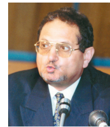
د. عبدالسلام العبادي

الأمين العام لمجمع الفقه الإسلامي الدكتور عبدالسلام العبادي أكد أن المملكة بقيادة خادم الحرمين الشريفين الملك عبدالله بن عبدالعزيز تنظر إلى الحوار على أنه يؤسس لعلاقات مع الآخر تقوم على الثقة والتفاهم والاحترام المتبادل وقادها هذا يضفي على الموضوع أهمية خاصة ويعطيه دلالات بعيدة تؤكد حرص ديننا الحنيف على الانلقاء مع الآخر والحوار معه في أسلم الطرق وأحسن الأنليات والصيغ لتحقيق تقدم البشرية وتحقيق خيرها وسعادتها.