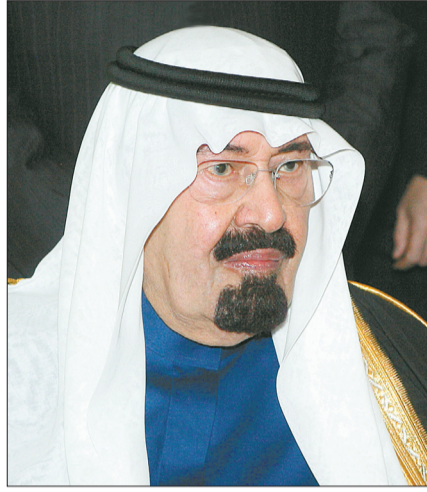
الملك عبدالله بن عبدالعزيز

عن سيده، وقوله صلى الله عليه وسلم «من فارق الجماعة شراً فارق الإسلام»، وتضمن الأمر الملكي تشكيل لجنة من وزارات (الداخلية، الخارجية، الشؤون الإسلامية والأوقاف والدعوة والإرشاد، والعدل، وديوان المظالم، وهيئة التحقيق والإدعاء العام، تكون مهمتها إعداد قائمة -تحدث دورياً- بالتيارات والجماعات المشار إليها في هذا الأمر، والرفع بها للنظر في اعتمادها. وفي ما يلي نص الأمر الملكي: بسم الله الرحمن الرحيم رقم: /٤٤ / ١٤٣٥