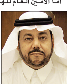
د. عبدالله السلمي

أما الأمين العام للهيئة العالمية للإعجاز العلمي في القرآن والسنة الدكتور عبدالله بن عبدالعزيز المصلح، فأوضح أن الإسلام هو دين الاعتدال والوسطية، الذي قال الله تعالى فيه: (وكنلك جعلناكم أمة