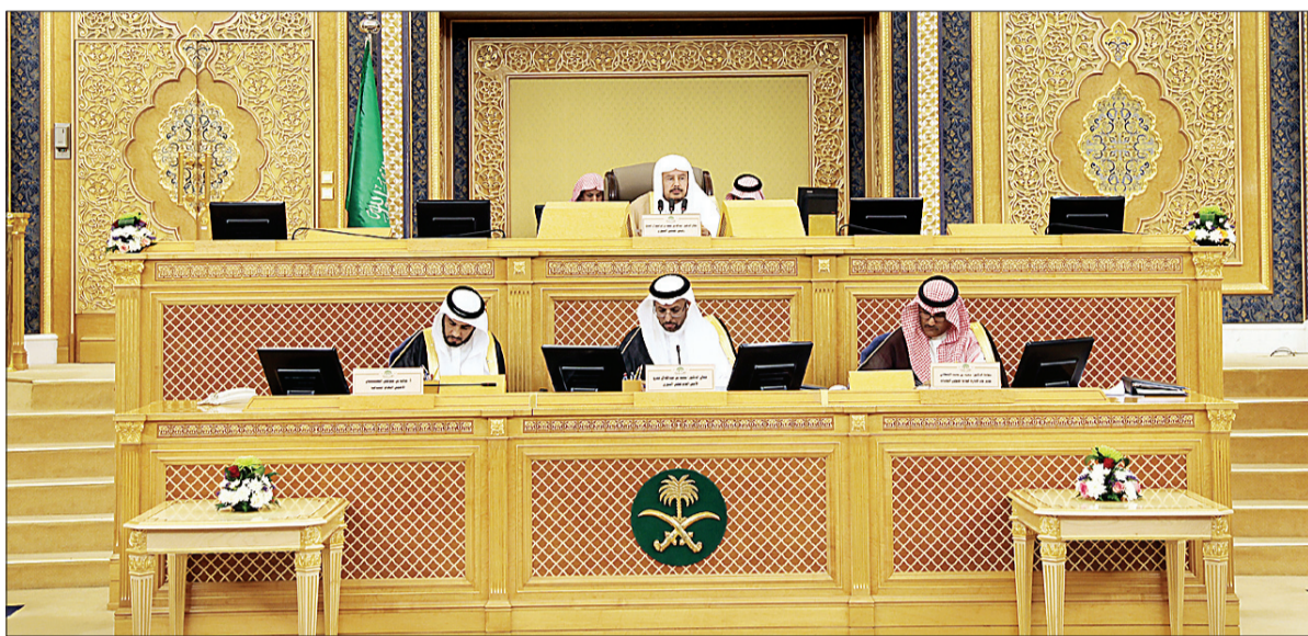
إحدى جلسات مجلس الشورى.

ويصوت المجلس في جلسته الثانية والثلاثين الثلاثاء المقبل على وجهة نظر لجنة