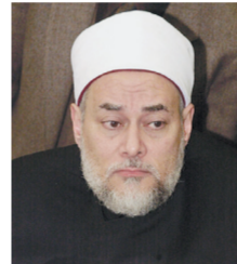
د. علي جمعة

مفتي مصر الدكتور علي جمعة أكد أن خادم الحرمين الشريفين يؤكد بدعوته للحوار على النهج الإسلامي الصحيح الذي تسير عليه المملكة لنشر ثقافة التسامح مع الآخر في مختلف أنحاء العالم مشيراً إلى أن الحوار والتعارف بين الأمم وبين أتباع الديانات السماوية من سنن الله تعالى في الكون وأن الإسلام دعانا إلى التعاون مع الآخر لتحقيق النفع والخير للبشرية مبيناً أن الحوار هو الذي يقود إلى معرفة الحقيقة والتعرف على الآخر عن قرب وينتج الفرصة إليه أيضاً ليعرف حقيقة الدين الإسلامي الحنيف.