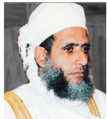
الشيخ أحمد الخليلي

المفتي العام لسلطنة عمان الشيخ أحمد بن حمد الخليلي أكد أن دعوة خادم الحرمين الشريفين الملك عبدالله بن عبدالعزيز -حفظه الله- تؤكد اهتمامه بالانفتاح على الآخر الذي يدعو إليه القرآن الكريم مشيراً إلى أنها دعوة تدل على إدراكه -حفظه الله- لما تتطلبه مصلحة الأمة التي إذا انفصلت عن نفسها كانت أمة هزيلة موضعاً أنها إضافة للانجازات التي يقوم بها خادم الحرمين الشريفين مما يدل على اهتمامه وإيمانه الشديدين بمدى أهمية وقيمة الحوار لتحقيق الخير لكل البشرية.