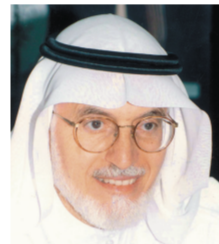
د. عبدالله نصيف

نائب رئيس مركز الملك عبدالعزيز للحوار الوطني الدكتور عبدالله عمر نصيف أكد أن دعوة خادم الحرمين للحوار تنطلق من دور المملكة إلى إرساء قواعد الحوار والتفاهم مع الدول والثقافات والأديان موضعاً أن هذه الدعوة أضافت لمسيرة الحوار بعداً جديداً، وهو استخراج ما في الأديان من مبادئ أخلاقية ودينية تساعد على توطيد الأخوة والسلام في العالم وإيجاد التعاون لكي تتحقق للإنسان إنسانيته خاصة أن العالم أصبح قرية واحدة فلا يتم هذا الأمر إلا بالتفاهم والتعاون والمحبة.