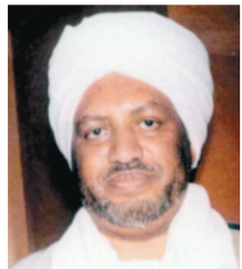
د. عصام البشير

الأمين العام للمركز العالمي للوسطية ووزير الأوقاف والإرشاد بالسودان سابقاً الدكتور عصام البشير أوضح أن دعوة خادم الحرمين الشريفين للحوار تنطلق من المنطلقات الإسلامية التي تدعو للحوار وتعزيز المشترك الإنساني والاعتدال في المسار الحضاري الإنساني أمام دعوات الإفصاء والاستئصال القائمة على صدام الحضارات ونهاية التاريخ موضحاً أن المؤتمر العالمي للحوار الذي وجه به خادم الحرمين الشريفين الذي بحث القيم المشتركة ينطلق من المنطلقات الإسلامية التي تدعو للحوار.