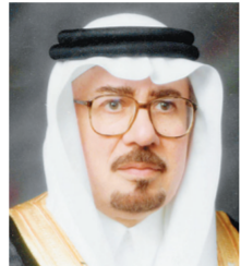
د. نزار مدني

وزير الدولة للشؤون الخارجية الدكتور نزار بن عبيد مدني أكد أن دعوة خادم الحرمين الشريفين للحوار هدفت لإزالة حالة الاحتقان التي تعيشها المجتمعات الإنسانية ومعالجة حالات الظلم والعداوة والكراهية ومواجهة ظواهره العنيفة والتطرف وحلحلة إقصاء الآخر مشيراً إلى أن أهمية هذه الدعوة تكمن في كونها تأتي في ظل ظروف دولية بالغة الدقة شهدت بروز معطيات جديدة ومقولات صدامية كصراع الحضارات وصراع الأديان والثقافات.