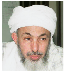
د. عبدالله بن بيه

نائب رئيس الاتحاد العالمي لعلماء المسلمين الدكتور عبدالله بن بيه أكد أنه يجب أن تحمل مبادرة خادم الحرمين الشريفين بشكل قوي مضموناً وشكلاً حتى تؤتي ثمارها مضيفاً أن المبادرة سيكون لها دور كبير في التنسيق للحوار ومشيراً إلى أنها تؤسس لعصر جديد من الحوار، وقد فتح باباً على الغرب لتقديم الحجة، ليقول لهم: إن أردتم الدخول في عصر جديد من الحوار فإن الفرصة الآن إتيحت لكم، وسوف تضبط الإيقاع والحركة وتحدد الأهداف بوضوح وهذا هو الذي يسمى بالاستراتيجية.