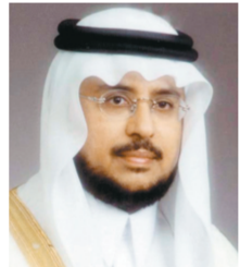
د. عبدالرحمن الزيد

الأمين العام المساعد لرابطة العالم الإسلامي لشؤون المساجد الدكتور عبدالرحمن الزيد أكد أن اهتمام خادم الحرمين الشريفين -حفظه الله- بالحوار ودعوة بلدان العالم وشعوبها إلى اتخاذ وسيلة للتفاهم والتعايش وتحويل النداء من أجل تفاهم الأمم عن طريق الحوار إلى واقع ميداني ومهام عملية لتأصيل مفهوم الحوار وأهدافه ووضع برامجه لتتخطى بعد ذلك أعمال الحوار في ندوات ومؤتمرات عالمية تشارك فيها الدول والمنظمات والشعوب المختلفة مبيناً أن النظرة الثاقبة لخادم الحرمين الشريفين تلمست حاجة الشعوب الإنسانية وهذا هو منطلقه في الدعوة إلى الحوار ورعاية مناشة ولقاءاته ومؤتمراته وبرامجه ومهامه.