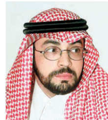
د. توفيق السديري

وكيل وزارة الشؤون الإسلامية لشؤون المساجد والدعوة والإرشاد الدكتور توفيق السديري أكد أن الدعوة الكريمة للحوار التي أطلقها خادم الحرمين الشريفين -حفظه الله- هي بداية الطريق للنقلة المطلوبة ولكي تبدأ الأمة الإسلامية بوضع أقدامها على الطريق الصحيح بين الأمم وأوضاع أن الوقوف أمام تجربتنا السابقة وترائنا فيما يتعلق بالحوار ودراسة واقعا خطوة مهمة لاستشراف آفاق المستقبل. تعقبها خطوات للبدء في نقلة جذرية بالحوار ترتكز فيها على أساس شرعي صلب مضيفاً بقوله إن ما نراه اليوم من اهتمام في مختلف الأوساط الإسلامية بالحوار إدراك لأهميته وفي مقدمة ذلك الدعوة الكريمة التي أطلقها خادم الحرمين الشريفين.