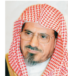
د. صالح بن حميد

رئيس مجلس الشورى الدكتور صالح بن حميد أكد أن دعوة خادم الحرمين الشريفين للحوار من أجل خير الإنسانية حيث رأى -حفظه الله- بأن الناس في العالم يحتاجون في الوقت الحالي إلى وقفة جادة في ظل المتغيرات المتسارعة والتفكك الأسري الذي يسود العالم كله فدعا المؤثرين على مستوى العالم والإنسانية جمعاء إلى أن يتنادوا ويسعوا في إنقاذ البشرية بالحوار مشيراً إلى أن الدين الإسلامي يدعو إلى الحوار والمجادلة بالتي هي أحسن بين كل الفئات.