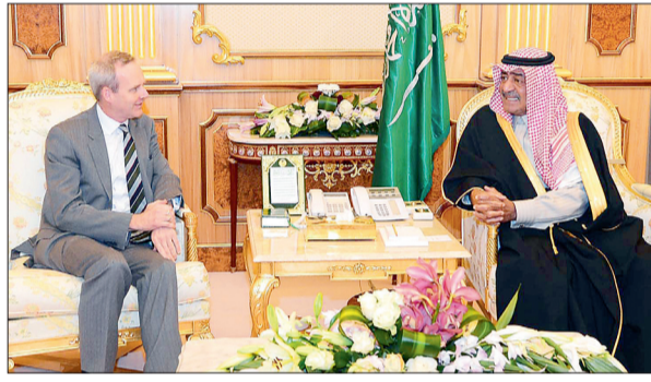
..السفير الألماني بوبريس روغه، (واس)