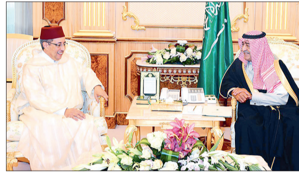
..ومستقبلاً السفير المغربي عبدالسلام بركة.