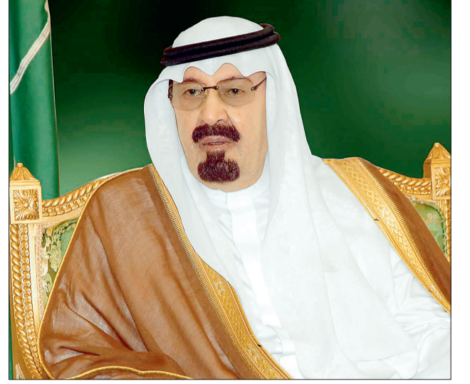
الملك عبدالله بن عبدالعزيز

وبين أمين عام الجائزة الدكتور عبدالله المعيقل أن الفائزين بالجائزة في دورتها الثانية الذين سيتم تكريمهم وتسليمهم جوائزهم الليلة (٢١) فائزاً، حيث فازت ٨ مبادرات بجائزة الفرع الأول (مبادرات الجهات الداعمة)، فيما فازت ٢١ مشروعاً بجائزة الفرع الثاني (مشروعات المستفيدين) الموجهة للنساء اللاتي أنشأن مشروعات، أدت إلى تمكينهن اقتصادياً واعتمادهن على أنفسهن، أما جائزة الفرع الثالث (الدراسات والأبحاث العلمية) فقد فازت به دراستان، ويبلغ مجموع الجوائز ١٠ ملايين ريال.