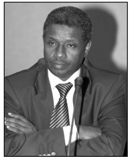
السفير عطا المنان

طالب الأمين العام المساعد لمنظمة المؤتمر الإسلامي والمتحدث الرسمي السفير عطا المنان بحيث بتوسيع الرؤية عند الحوار مع الآخر إلى ما هو أشمل ولا نضييقها في إطار حوار أتباع الأديان فحسب بل هناك حوار بين الثقافات والحوار بين الحضارات موضحاً أنه مع وجود القضايا المشتركة قضايا في الحوارات المختلفة إلا أن هناك خصوصيات بين هذه الحوارات وقال في حديثه لـ «عكاظ»: المطلوب عندما نتحاور مع الآخر أن نتكلم عن الإشكالات