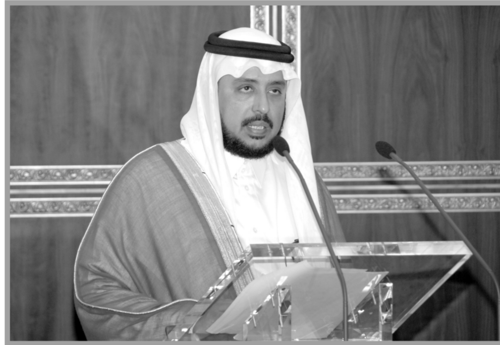
الزيد يقرأ توصيات المؤتمر الإسلامي العالمي للحوار في مكة المكرمة

على شعوب البشرية "قل يا أيها الناس إنني رسول الله إليكم جميعاً" مشيراً إلى أن الإسلام لم يكن في حقيقته من حقب التاريخ دعوة إقليمية أو قومية أو محلية موضحاً أن المؤتمر سيوضح لأمم العالم سماحة الإسلام وعظمة مبادئه في العدالة والحرية والأمن والسلام والتعايش والتعاون وحماية حقوق الإنسان ورعاية المرأة وصون الطفولة والمحافظة على البيئة مبيحاً أنها مبادئ تحتاج إليها الشعوب في أنحاء العالم الذي تعج فيه الموبقات والفساد وتكتاثر فيه المشكلات والتحديات والذي تصدع تماسكه وتعاون الناس فيه دعوات الصراع والصدام بين الأمم والحضارات.