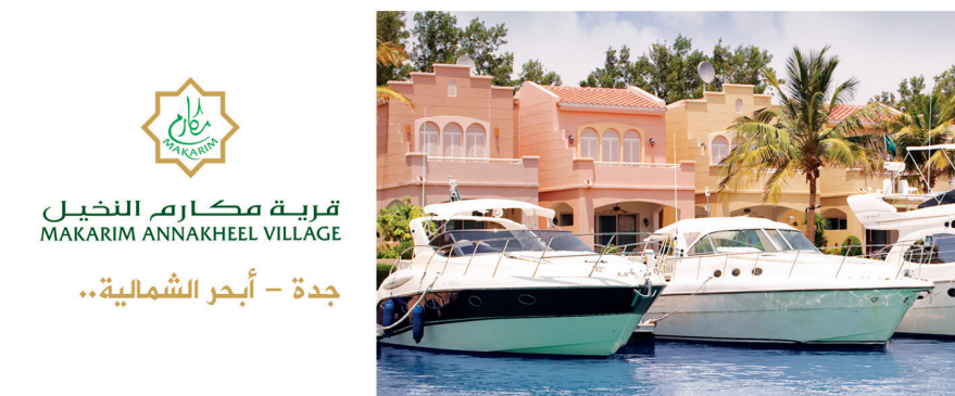
قرية مكارم النخيل MAKARIM ANNAKHEEL VILLAGE