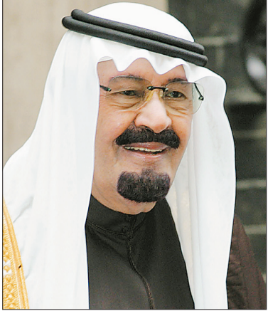
خادم الحرمين الشريفين.