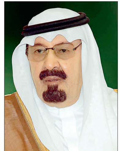
الملك عبدالله بن عبدالعزيز

نائب رئيس مجلس الوزراء وزير الدفاع، برفقة ممثلة لفخامة الرئيس حسن شيخ محمود عبر فيها عن أبلغ التهاني وأطيب التمنيات بموفور الصحة والسعادة لفخامته، ولحكومة وشعب جمهورية الصومال الفيدرالية الشقيق المزيد من التقدم والازدهار.