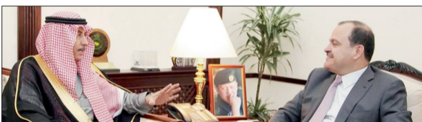
المجالي مستقبلاً السفير الصالح أمس في الأردن.

المجالات الأمنية والاقتصادية والسياسية والاجتماعية سينعكس إيجاباً على مصالح الشعبين الشقيقين. من جهته، أكد السفير الصالح حرص المملكة على تعزيز العلاقات الثنائية مع الأردن والتي تزداد متانة ورسوخاً يوماً بعد آخر، مشيراً إلى تطابق مواقف البلدين حيال مختلف القضايا العربية والإقليمية والدولية. تم خلال اللقاء بحث سبل تعزيز آفاق التعاون الثنائي بين البلدين الشقيقين في مختلف المجالات.