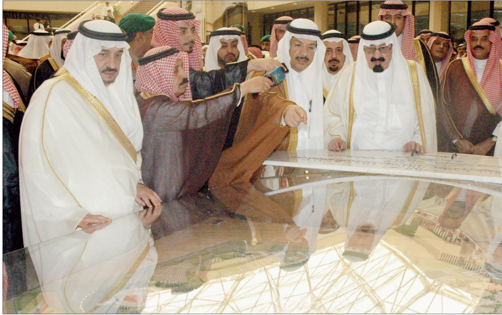
خادم الحرمين الشريفين لدى تدشين جامعة التوحيد بحضور الأمير فيصل بن بندر - عكاظ

واستعرض مسيرة جامعة القصيم بهذه المناسبة قائلاً: بلغت الجامعة مؤخرًا عقدها الأول منذ تأسيسها عام ١٤٢٤هـ - ٢٠٠٤م وتسير - ولله الحمد - وفق خطتها الاستراتيجية نحو آفاق التميز في شتى المجالات، حيث حققت مؤخرًا الاعتماد المؤسسي من قبل الهيئة الوطنية