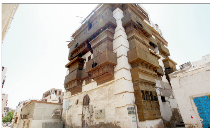
عمارة تراثية في المنطقة التاريخية.