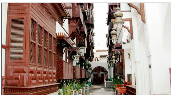
المنطقة التاريخية في جدة كما بدت أمس.