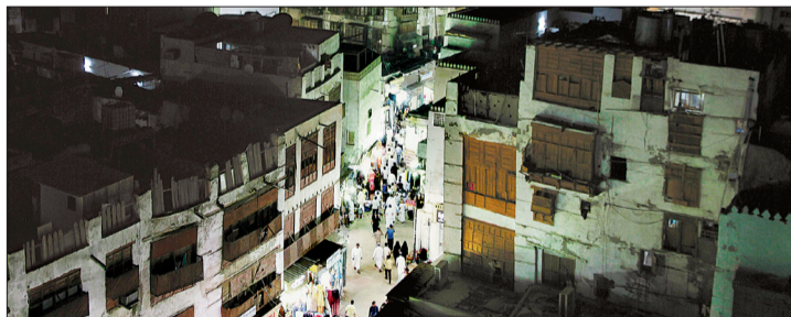
مظاهر الحياة الاجتماعية بالمنطقة التاريخية في الأعياد.