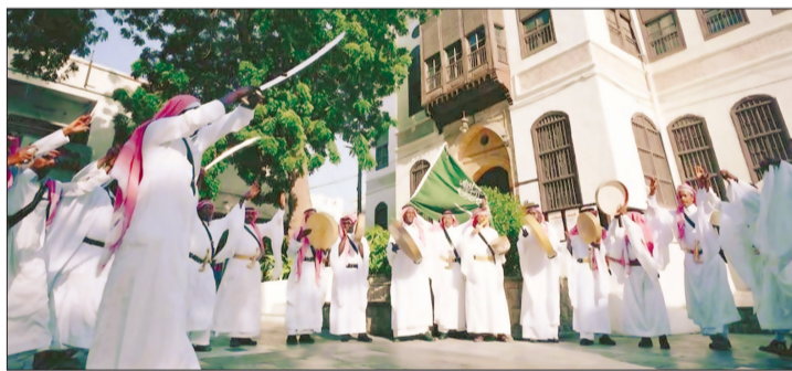
عرض شعبية في المنطقة التاريخية في إحدى المناسبات.