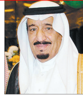
الأمير سلمان بن عبدالعزيز

نيابة عن خادم الحرمين الشريفين الملك عبدالله بن عبدالعزيز آل سعود، يفتتح صاحب السمو الملكي الأمير سلمان بن عبدالعزيز آل سعود ولي العهد نائب رئيس مجلس الوزراء وزير الدفاع، الملتقى العلمي الرابع عشر لأبحاث الحج الذي تقيمه جامعة أم القرى ممثلة بمعهد خادم الحرمين الشريفين لأبحاث الحج والمعمره، يوم الأربعاء