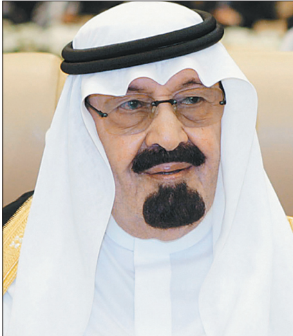
الملك عبدالله بن عبدالعزيز

ضخمة للخزينة العامة أو إنقاذ كميات كبيرة من أموال الدولة من خطر محقق.