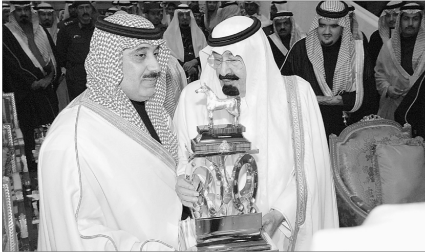
○ خادم الحرمين الشريفين يسلم الأمير متعب بن عبدالله كأس الملك في الموسم الماضي. ○

تعكس حرصه - حفظه الله - على دعم هذه الرياضة العربية الأصيلة. ورفع الزيدني الشكر لصاحب السمو الملكي الأمير سطاتم بن عبدالعزيز أمير منطقة الرياض لحضوره هذه المناسبة كما قدم شكره لجميع الملاك والمدربين والخيالة ومحبي الفروسية لهذه المناسبة الغالية. وقال: إن محبي ومتابعي وعشاق رياضة الفروسية يسعدون دائماً بهذه الرعاية الكريمة من سموه الكريم في إطار ما تلقاه هذه الرياضة من دعم كبير من حكومة خادم الحرمين الشريفين. وأكد أن النادي أكمل جميع الترتيبات التي تكفل بإذن الله تعالى نجاح هذه المناسبة الكبيرة بتوجيه مباشر من صاحب السمو الملكي الأمير بدر بن عبدالعزيز نائب رئيس نادي الفروسية الذي حرص على تكامل جميع الترتيبات ويقف على الاستعدادات التي من شأنها إظهار هذه المناسبة بالمظهر المشرف حيث وجهت الدعوات إلى أصحاب السمو الملكي الأمراء وأصحاب المعالي الوزراء وكبار المسؤولين من مدنيين وعسكريين واعضاء نادي الفروسية. ■