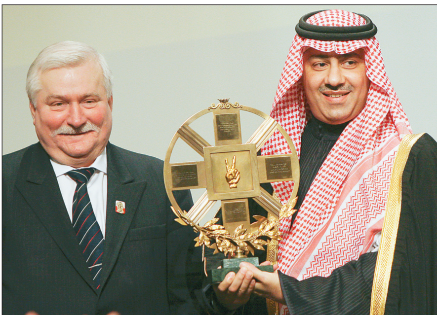
الأمير عبد العزيز بن عبد الله يتسلم جائزة ليخ فاليسا الأولى نيابة عن الملك من الرئيس البولندي السابق أمس في جدانسك.

الأمير عبد العزيز بن عبد الله يتسلم جائزة ليخ فاليسا الأولى نيابة عن الملك من الرئيس البولندي السابق أمس في جدانسك. من جهة ثانية تم أمس تسليم جائزة ليخ فاليسا الأولى التي اختير خادم الحرمين الشريفين لفوز بها. - مستشار خادم الحرمين الشريفين - وقد رآه عدد الحجاج القادمين لهذا العام من العام الماضي (٢٠٠٦ - ٢٠٠٧) حاجاً، بنسبة قدرها (١٠٠) بالمائة. ويبلغ عدد دخول حجاج هذا العام عن طريق الجو (٦٤٥، ٥٧٥) حاجاً، وعن طريق البحر (٣٥٣، ١٢٦) حاجاً، وعن طريق البحر (٨٤٣، ٢٢٠) حاجاً. ويمثل حجاج هذا العام (١٧٨) جنسية من مختلف أقطار العالم. من جهة ثانية قامت الأمانة العامة لجائزة نايف بن عبد العزيز آل سعود العالمية للسنّة النبوية والدراسات الإسلامية المعاصرة بمراسلة أكثر من ١٠٠ جامعة وكلية داخل وخارج المملكة لترشيح من يستحق نيل الجائزة التقديرية لخدمة السنّة وعلومها في دورتها الثانية. وقال مستشار وزير الداخلية الأمين العام للجائزة الدكتور ساعد العرابي الحارثي: إن الجائزة التقديرية افتخرت في دورتها الأولى باختيار خادم الحرمين الشريفين الملك عبد الله بن عبد العزيز نيل جائزة نايف بن عبد العزيز التقديرية العالمية لخدمة السنّة النبوية تقديراً لجهوده في مجال خدمة الإسلام والمسلمين، وبما يتمتع به من صفات إسلامية أصيلة