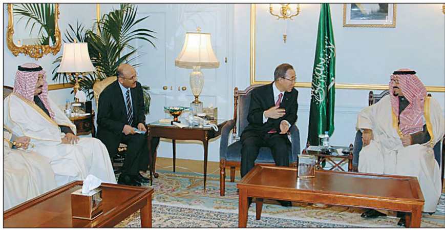
ولي العهد يستقبل في مقر إقامته في نيويورك بان كي مون، ويبدو الأمير سلمان خلال اللقاء أمس.