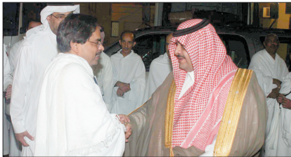
الأمير تركي بن سلطان مرحباً بالاعلاميين في منى أمس، ويبدو د. صالح النملة.

واس - منى أكد الأمير تركي بن سلطان بن عبدالعزيز، مساعد وزير الثقافة والإعلام، المشرف العام على أعمال الوزارة في الحج، أن وزارة الثقافة والإعلام تقدم وسائل الإعلام المرئية والسمعية والمقروءة على التغطية المميزة لهذه الشعيرة العظيمة مع تأمين جميع التسهيلات المهمة للنقل التلفزيوني والإذاعي ووكالات الأنباء والصحافة. وأبرز الأمير تركي خلال استقباله، أمس، ضيوف الوزارة من كبار الشخصيات الأدبية والفكرية والباحثين ورجال العلم والمعرفة من الدول الإسلامية والعربية ورجال الإعلام الذين يؤدون مناسك الحج هذا العام والإعلاميين، الخطة الإعلامية لحج هذا العام ١٤٢٩هـ، مبيناً أنها تسمير وفق ما خطط لها، وقال: إن المتابعة الدقيقة لتلك الخطة الإعلامية تأتي وفق الرؤية المتخصصة من جميع قطاعات الوزارة لنقل شعائر الحج على الهواء مباشرة لجميع دول العالم.