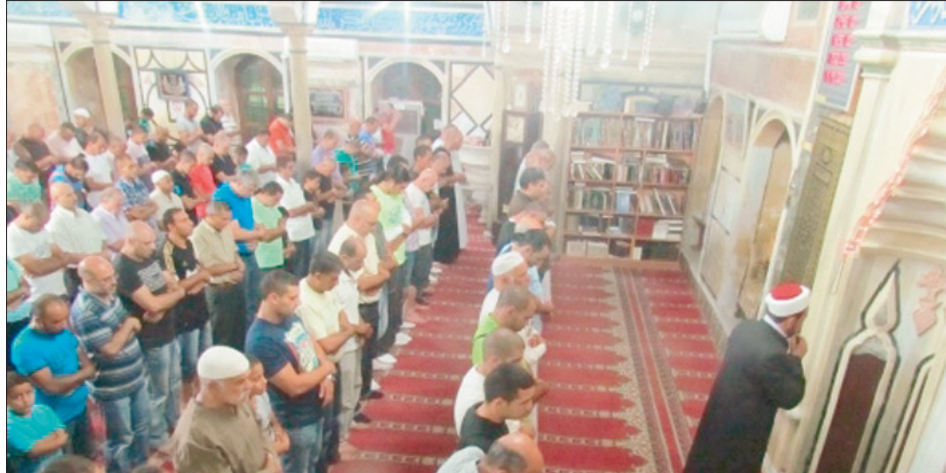
لبنانيون يؤدون صلاة الغائب على فقيد الأمة الملك عبدالله.

وأضاف الوزير ريفي: لقد كان للمغفور له الملك عبدالله بن عبدالعزيز رؤية سياسية استراتيجيّة، ففي الوقت الذي كرس جهدا خاصا للتنمية داخل المملكة فطرح إلى إنشاء مركز حوار الحضارات كان غيره في هذا الوقت يدعو إلى صراع الحضارات. وأضاف: لا يمكن أن ننسى ما قدمه المغفور له على صعيد مكافحة الإرهاب حين دعم مركز الأمم المتحدة، حيث كانت له رؤية لكيفية أن تتخلص البشرية من