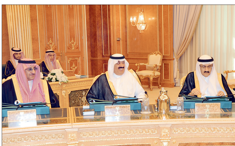
الأمراء منصور بن متعب، متعب بن عبدالله، محمد بن نايف خلال الجلسة.

لجنة تنسيق خدمات ذوي الإعاقة تضم ٩ جهات حكومية و٤ مختصين مذكرة تفاهم في مجال الخدمة المدنية بين المملكة واليابان